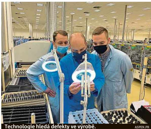
Technologie hledá defekty ve výrobě.

Algoritmus, který takto vznikl, dokáže provádět analýzu na světové úrovni. Přitom celý proces má velmi jednoduchý základ. Vyčlení výrobky, jež jsou bezchybné a software se je naučí, což mu zabere řádově několik minut. Pak je porovnáním schopen vybrat defekty a anomálie na dalších výrobcích.