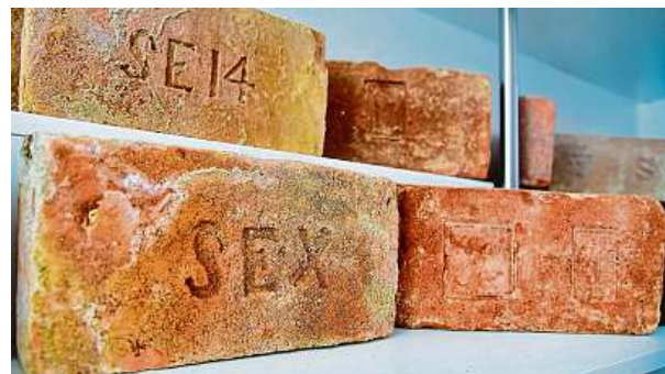
Zřejmě nejsledovanější exponát výstavy