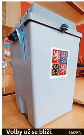
Volby už se blíží. MAFRA

Prioritou je stav krajiny a zadržování vody v ní a také obnova ekonomiky po koronakrizi. V oblasti zadržování vody v krajině bychom realizovali, ve spolupráci s Povodím Moravy, projekty meandrování dnů napřímených toků řek. Chceme také založit klimatickou agenturu, která by radila obcím, a podporovat změny zemědělské krajiny. Na řešení dopadu korona-