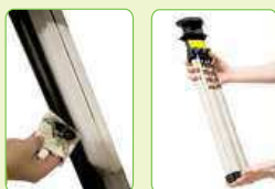
Filtry není třeba nikdy vyměňovat! Stačí je jen občas jednoduše vyjmout a otřít. Účinek filtrace ihned vidíte!