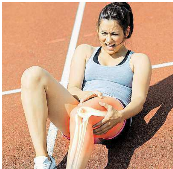
Nyní si můžete dát zkontrolovat kosti zdarma.

Nejvíce se to týká starších lidí. Pozor by si měly dát i ženy po menopauze, neboť u nich klesá hladina pohlavních hormonů. KAMILA HUDEČKOVÁ