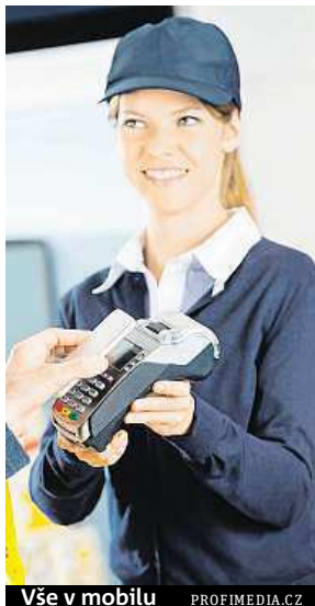
Vše v mobilu PROFIMEDIA.CZ

Dnes už i nastoupit do letadla můžete bez tištěné palubní vstupenky. I když, jak upo-