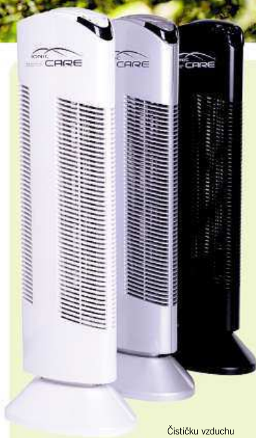
Čističku vzduchu Ionic-CARE Triton X6 můžete zakoupit ve třech barevných provedeních.