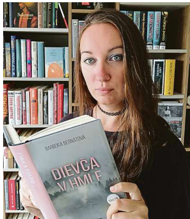
Největšími vzory ve psaní jsou pro spisovatelku Elena Ferrante, J. K. Rowlingová a Joël Dicker.