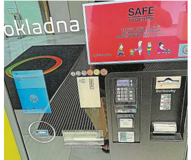
Parkovací automat působí, jako by byl v provozu, již od roku 2021. Pár měsíců předtím jej překryval igelit.

Je všeobecně známým faktem, že kvůli parkování v Centru Černý Most v současnosti nejsou o pár korun leh-