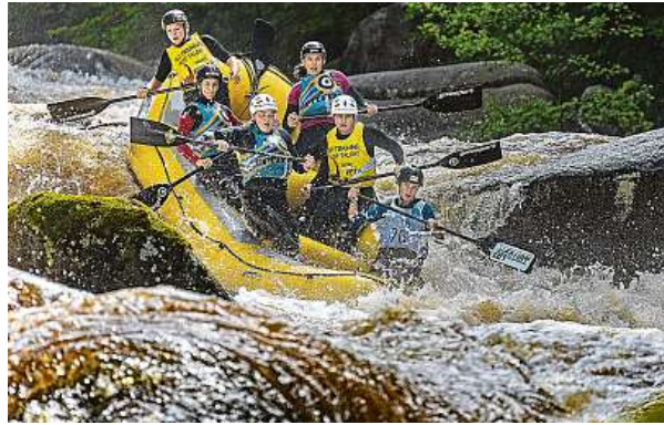
Tým vodáků při boji s peřejemi na Lipně. Stále více populární se stává řeka Vltava, která je v sezóně velmi vytižená.

Obecně informace o stavu vody dostupné jsou, je však