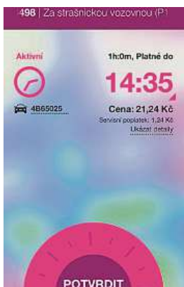
Náhled nové aplikace Easy Park EASYPARKPARTNERS.COM

FILIP JAROŠEVSKÝ filip.jarosevsky@metro.cz