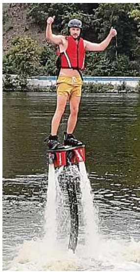
Palce nahoru. Chci letět výš. MET

Protože je o zážitek od firmy Adrop.cz velký zájem, termín mám až od šesti večer. Vůbec to ale nevádí. Vltava je teď v létě teplá. Zoufám si a po očku sleduji ostatní při