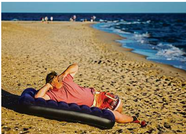
Někomu je na pláži samotnému dobře, jiný potřebuje k odpočinku společnost. Single cestovatelé hledají ale spíše aktivní volno.