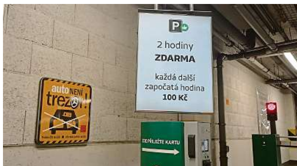
Galerie Harfa je obchodní, zábavní a administrativní centrum v Libni. Fotografii jsme na zdejší parkovišti pořídili minulý čtvrtek.