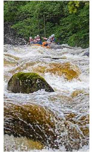
Celkový pohled na peřeje a vodáky na Lipně

Co se týče vybavení, svaz v desateru apeluje mimo jiné na vhodnou obuv. „Doporučujeme házeč pytlík s karabinou, lékárnu, náhradní pádlo, mobil s vodotěsným obalem, vestu a přilbu. Při jízdě je potřeba vhodné oblečení a pevné uzavřené boty,“ píše se v příručce. Právě například házeč pytlík může pomoci při záchraně topícího, aby se mohl chytit. V krizové situaci se doporučuje zavolat záchraňáře. TEREZA ŠIMURDOVÁ