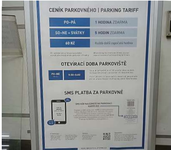
Jedna hodina parkování zdarma ve všední den. Pět hodin parkování zdarma o víkendech a státních svátcích. To je OC Nový Smíchov.

Využívat obchodní centra v hlavním městě jako celodenní „odkladistiště“ pro vozy už dávno není výhodnou záležitostí.