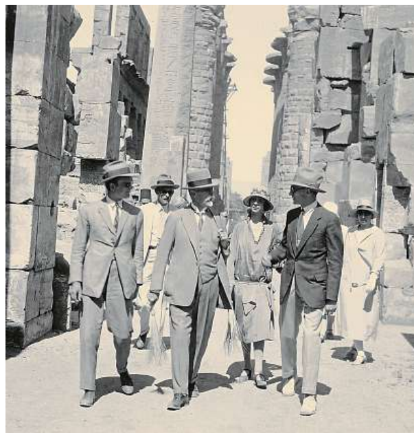
Masaryk se zasadil o vznik Orientálního ústavu.

Za druhé světové války, kdy byly násilně uzavřeny české vysoké školy, zprostředkoval ústav pokračování výuky studentů a vědeckého bádání orientalistů.