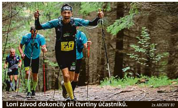
Loni závod dokončily tři čtvrtiny účastníků.

Třináctý ročník extrémního závodu klepe na dveře a tisíce účastníků letošní Beskydské sedmičky si po dvou covidových ročnících užijí legendární závod v plné kráse.