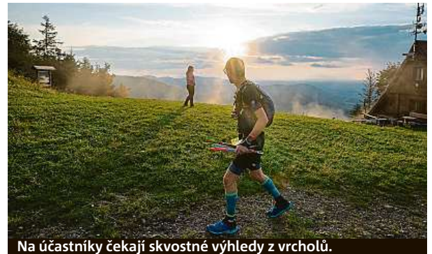
Na účastníky čekají skvostné výhledy z vrcholů.

Vzhledem ke zvýšenému zájmu diváků a fanoušků v posledních letech sledovat účastníky B7 přímo na trase dojde letos v údolích na místech občerstvovacích stanic k dočasněmu omezení dopravy, aby byl zabezpečen průjezd vozidly Integrovaného záchranného systému.