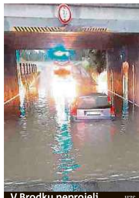
V Brodsku neprojeli. HZS

Nejvíce škod likvidovali hasiči v jižních Čechách a ve Středočeském kraji. Například na dálnici D1 před Prahou se po silném lijáku vytvořila neprůjezdná laguna.