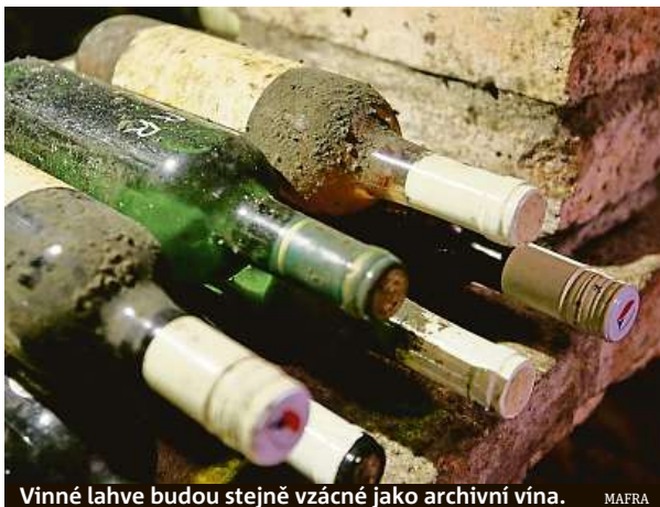
Vinné lahve budou stejně vzácné jako archivní vína.