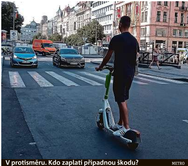
V protisměru. Kdo zaplatí případnou škodu?

„Byla to jen otázka času, kdy právě kvůli rostoucímu počtu nehod s případným odškodněním pro poškozeného