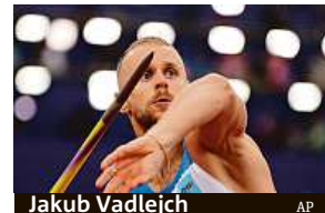
Jakub Vadlejch

Oštěpařka Barbora Špotáková vybojovala na mistrovství Evropy posledním hodem bronzovou medaili. Jednačtyřicetiletá světová rekordmanka se v dramatické závěrečné sérii posunula hodem dlouhým 60,68 metru dokonce na druhé místo, z něhož ji vzápětí odsunula teprve osmnáctiletá Srbka Adriana Vilagošová, která se zlepšila na 62,01 metru. Mistryni Evropy se stala další zástupkyně nastupující generace. Devatenáctiletá Řekyně Elína Tzengkoová hodila už v druhé sérii osobní rekord 65,81 a zajistila si vítězství.