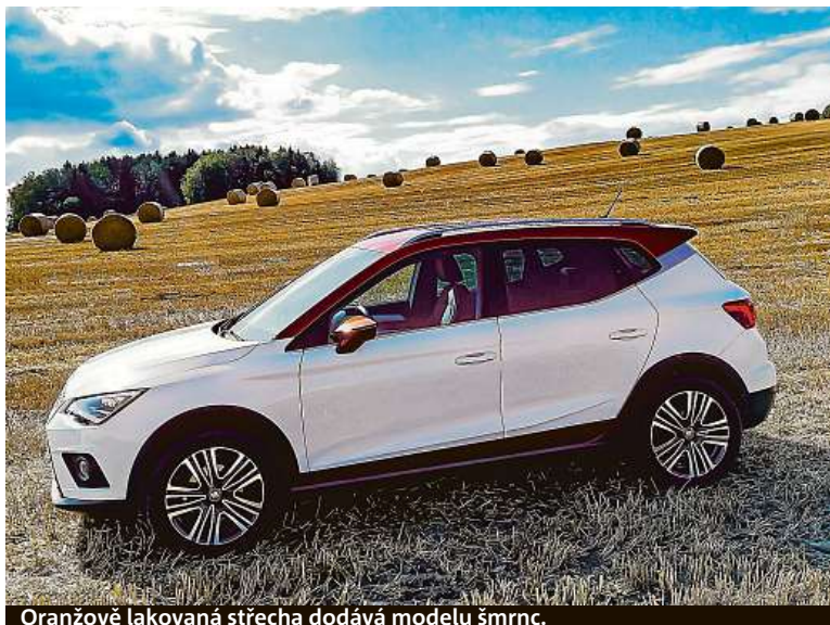
Oranžově lakovaná střeška dodává modelu šmrnc.