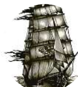
Milan Lovce Zika Pobavil mě PAN RAMBO.