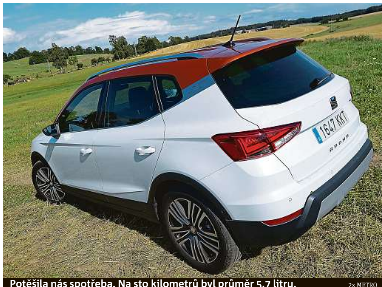
Potěšila nás spotřeba. Na sto kilometrů byl průměr 5,7 litru.