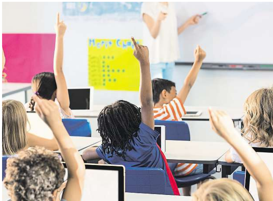
Moderní technika včetně digitálních tabulí a tabletů je pro děti samozřejmostí. PROFIMEDIA.CZ

K supermoderním novinkám ve školkách patří digitální mikroskopy, digitální dětská kamera či fotoaparát nebo takzvaná robotická včela. Ta děti učí základům matematiky. „Pracuje se s matematickou pregramotností. Pomocí jednoduchého programování se dokáže na stisknutí tlačítka pohybovat. Děti cestu programují po obrázcích, v logických souvislostech. Další novinkou je mluvící skřípce, na který učitelka nahraje informaci a dítě si ji pustí, když ji potřebuje,“ říká Vondráková. FILIP JAROŠEVSKÝ