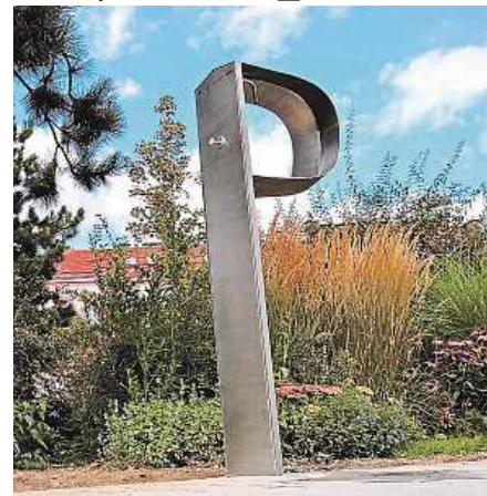
První pítko stojí na Ortenově náměstí. P7