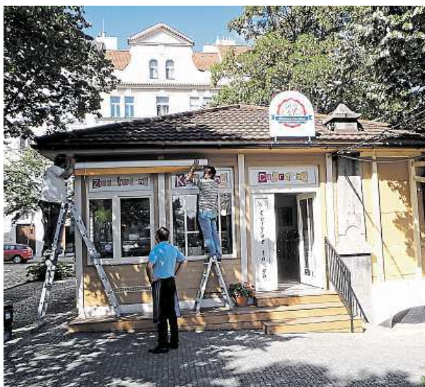
Nevyužívané záchodky na Synkáči se změny na zmrzlinárnu.

Zrušené záchodky byly v minulosti v metropoli občas přestavěny v hernu, bufet nebo hospůdku. Před několika lety také vznikla na Ostrčilově náměstí Japonská pekárna z objektu, který byl sice jako veřejný záchodek postaven, ale nikdy tak nebyl užíván. Tradiční podzemní záchod, postavený ve 20. letech 20. století, už funguje v metropoli asi jediný, a to na Uhelném trhu. FILIP JAROŠEVSKÝ