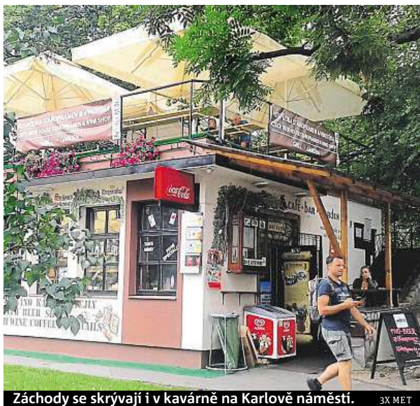
Záchodky se skrývají i v kavárně na Karlově náměstí.