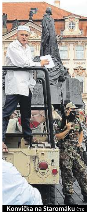
Konvička na Staromáku ČTK

Po střelbě ale začali mnozí kolemjdoucí utíkat, magistrátní úředník proto ve spolupráci s policií akci ukončil. „Policie nyní zjišťuje, zda při akci nebyl spáchán trestný čin šíření poplašné zprávy, řekl mluvčí policie Tomáš Hulán. Policie podle něj proto vyzvala osm lidí k podání vysvět-