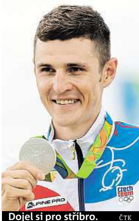
Dojel si pro stříbro.

V průběhu závodu vše nasvědčovalo repríze čtyři roky starého souboje obou rivalů. Hlavní favorité se brzy usadili v čele a vzdalovali se ostatním. Na závěrečný finiš ale tentokrát nedošlo. Schurter rozhodl nástupem v předposledním ze sedmi okruhů, na který už