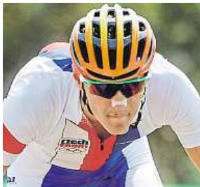
Jaroslav Kulhavý ČTK metroSPORT Olympijské hry v Riu

Biker Jaroslav Kulhavý dojel při obhajobě olympijského zlata druhý za Švýcarem Nitem Schurterem, který mu oplatil čtyři roky starou porážku z Londýna. Pro českou výpravu v Riu vybojoval Kulhavý v poslední soutěžní den jubilejní desátou medaili.