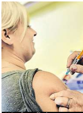
V Brně se očkuje. ČTK

Hepatitida A obecně je zánět jater, jehož původcem je virus. Zákeřnost onemocnění pak spočívá právě především v jeho velmi snadném přenosu – skrze infikované potraviny a vodu a především prostřednictvím „špinavých“ rukou. Virus přežívá i mimo tělo přenašeče, takže ho můžete najít na madle v MHD, na klíče u dveří, ale třeba i na vodovodní baterii na veřej-