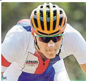
Jaroslav Kulhavý

Biker Jaroslav Kulhavý dojel při obhajobě olympijského zlata druhý za Švýcarem Nitem Schurterem, který mu oplatil čtyři roky starou porážku z Londýna. Pro českou výpravu v Riu vybojoval Kulhavý v poslední soutěžní den jubilejní desátou medaili.