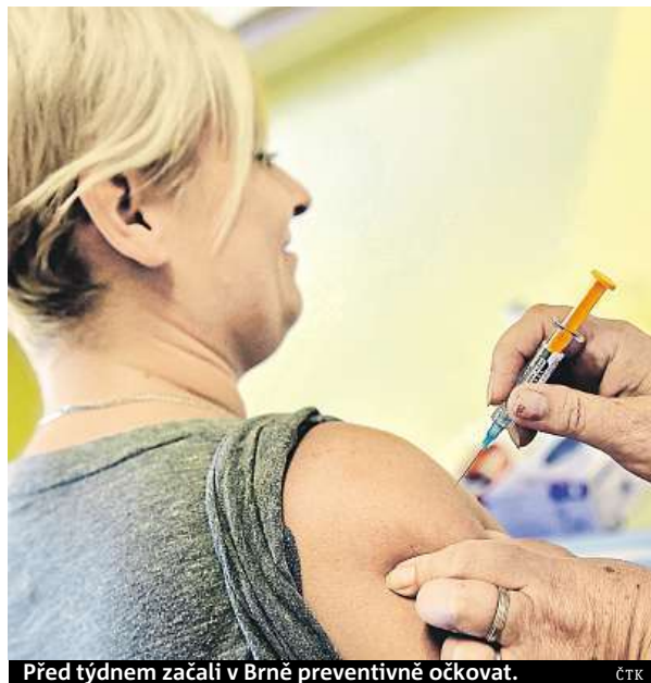
Před týdnem začali v Brně preventivně očkovat.

„Pokud špinavou rukou nejprve spustíme pákovou baterii, bakterie na ní jednoduše počkají, než ji čistou rukou