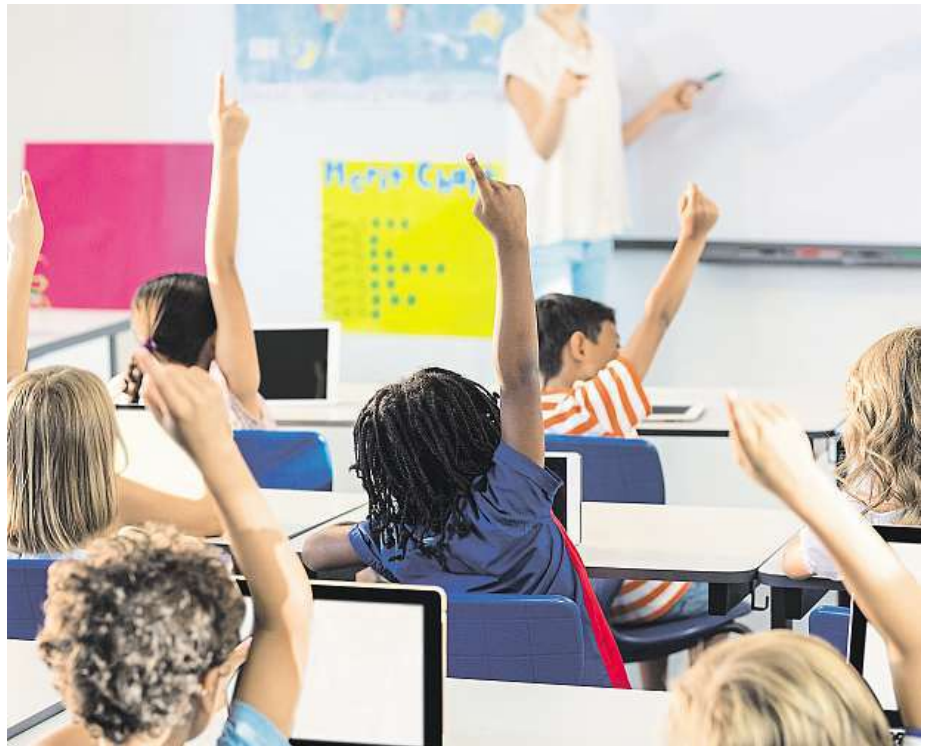
Moderní technika včetně digitálních tabulí a tabletů je pro děti samozřejmostí.

Mezi supermoderní novinky ve školkách patří třeba digitální mikroskopy, digitální dětská kamera či fotoaparát nebo takzvaná robotická včela. Ta děti učí základům matematiky. „Pracuje se s matematickou pregramotností. Pomocí jednoduchého programování dokáže včela na stisknutí tlačítka jet dopředu, dozadu, vpravo a vlevo. Děti cestu programují po obrázcích, po logických souvislostech. Další novinkou je mluvící skřípěc, na které učitelka nahrává informaci a dítě si ji může pustit v momentě, kdy ji potřebuje,“ říká Vondráková. Důležité je, aby si pedagogové uvědomili, že nové metody nenahrazují staré, ale pouze je rozšiřují. FILIP JAROŠEVSKÝ