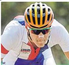
Jaroslav Kulhavý

Biker Jaroslav Kulhavý dojel při obhajobě olympijského zlata druhý za Švýcarem Nitem Schurterem, který mu oplatil čtyři roky starou porážku z Londýna. Pro českou výpravu v Riu vybojoval Kulhavý v poslední soutěžní den jubilejní desátou medaili.