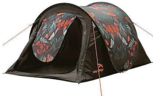
Stan za super cenu

Kde? Možná vás teď lehce zaskočíme, ale odpověď zní: v Mironetu. Říkáte si: „V tom obchodě s elektronikou?“ Ano, přesně tak. Mironet se totiž už pěkných pár měsíců nezaměřuje výhradně jen na