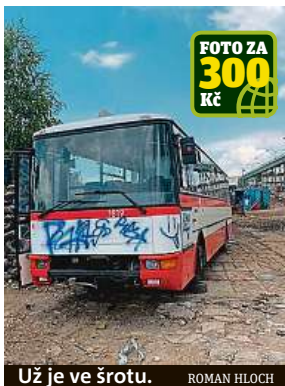
Už je ve šrotu. ROMAN HLOCH

„Věřte, že nebylo jeho cílem jej nechat někde odstavený dlouhodobě,“ napsal Jůza,