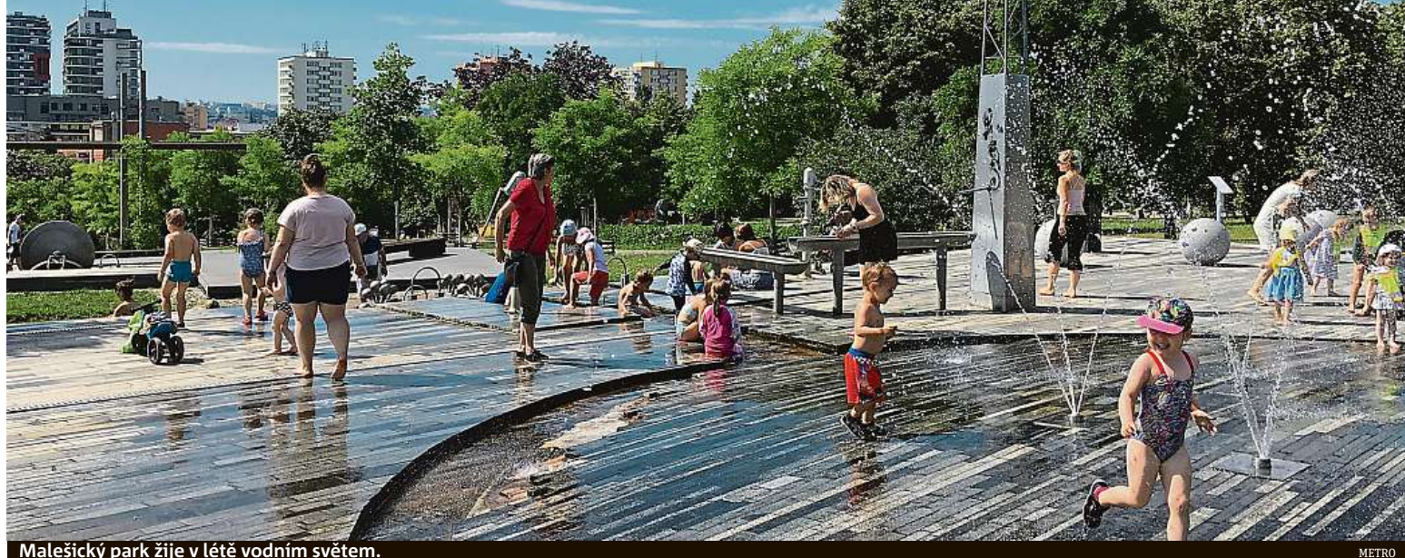
Malešický park žije v létě vodním světem.