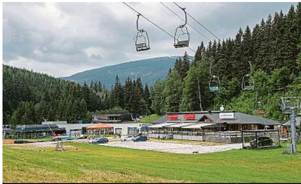
Na tomto místě vyroste stadion pro 7500 diváků.

Organizátoři českého Winter Classic chystají také duel českých a slovenských hokejových legend.