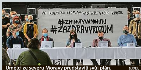
Umělci ze severu Moravy představili svůj plán.

Čeští policisté převzali 14 lidí, kteří byli zadrženi ve Velké Británii kvůli různým trestným činům. Šlo o největší předání lidí