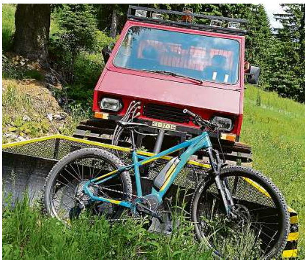
Když zima potká léto. Rolba u chaty Vendlovka.

Za vývojem a výrobou těchto kol stojí firma BP Lumen, která vyrábí i kola Apache.