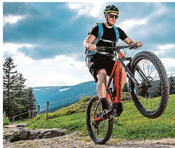
Toto je celoodpružený model eFS1. Vlevo je eHT1.