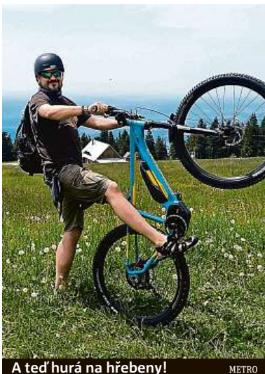
A teď hurá na hřebeny!

Dobíjení se vyplatí při vypůjčení kola na víkend. Pokud budete s jízdniemi režimy zacházet s rozumem, v pohodě čtyřicetkilometrový výlet z Janských Lázní na Luční boudu a zpět dáte za čtyři hodiny. Cestou použijete dvě lanovky, kabinku hned v úvodu a pak sedačkovou z Pece na Hnědý vrch. Šťastnou cestu! PETR HOLEČEK