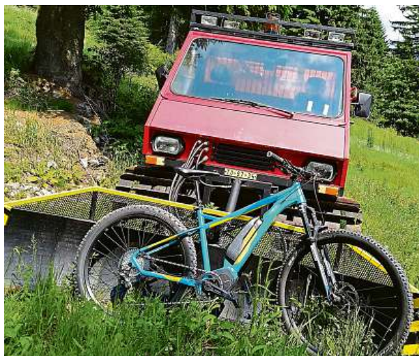
Když zima potká léto. Rolba u chaty Vendlovka. METRO

Za vývojem a výrobou těchto kol stojí firma BP Lumen, která vyrábí i kola Apache.