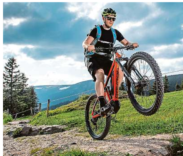
Toto je celoodpružený model eFS1. Vlevo je eHT1. SKIRESORT