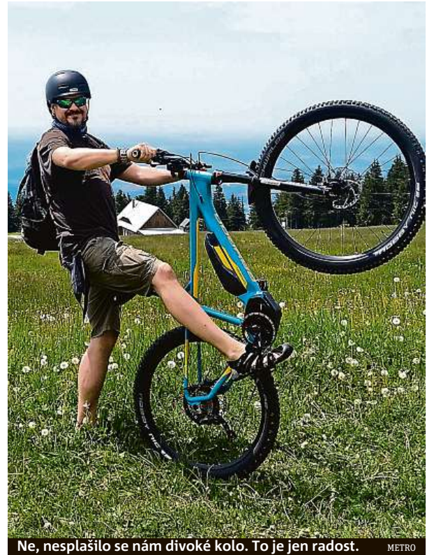
Ne, nesplánilo se nám divoké kolo. To je jen radost.