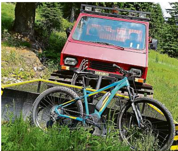
Když zima potká léto. Rolba u chaty Vendlovka.

Za vývojem a výrobou těchto kol stojí firma BP Lumen, která vyrábí i kola Apache.