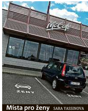
Místa pro ženy SARA YASSINOVA

„Zkoušeli jsme, zda se naše zákaznice budou cítit bezpečněji, když budou moci zaparkovat přímo u vchodových dveří do restaurace. Šlo nám zejména o dobu večerního provozu, kdy se mohou ženy cítit ohroženy. Chtěli jsme jim nabídnout více osvětlení