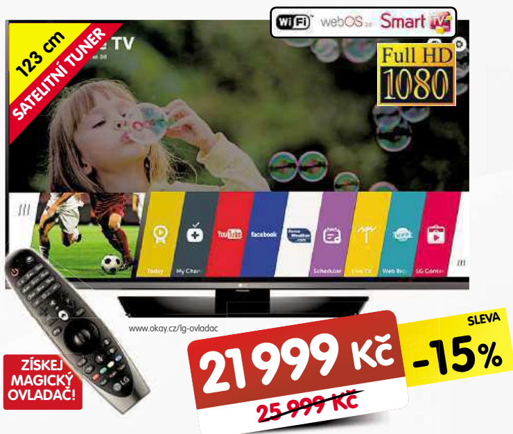
SMART LED TELEVIZOR LG 49LF630V

• 10.1" IPS dotykový displej • 4jádrový procesor 1,3 GHz • 1 GB RAM • 16 GB ROM • Wi-Fi • 2 Mpix přední/5 Mpix zadní kamera • micro USB • micro HDMI • microSD až do 32 GB • Android 4.4 KitKat