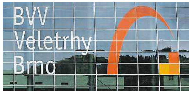
Veletrhy Brno se v posledních letech dostaly do zisku.

Vokřál ale řekl, že ve hře jsou tři varianty. „Město může podíl koupit samo a s managementem společnosti vytvoří koncept, jak dál areál využívat a více ho otevřít lidem, aniž se naruší veletržnictví. Pokud se s Messe Düsseldorf nedohodneme, budeme hledat finančního partnera, který by část podílu odkoupil. Jako město bychom si ale chtěli nechat většinový podíl, abychom měli vliv na chod firmy,“ uvedl Vokřál. Poslední možností by bylo hledání další veletržní