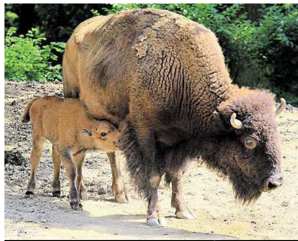
Na Mniší hoře se daří například také bizonům.

„Uvažovali jsme dokonce o vybudování zubačky, ale nový systém, o němž se nyní jedná, je levnější, efektivnější a věřím tomu, že by z něj byla velká atrakce,“ doplnil ředitel. ČTK