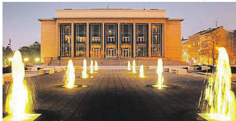
Budova je v havarijním stavu, obkladové desky praskají a opadávají.