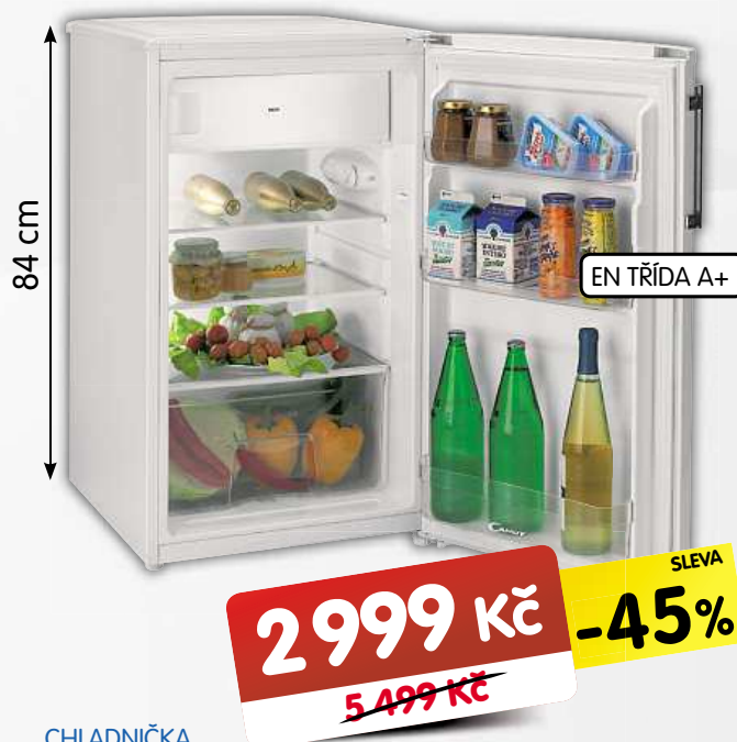
CHLADNIČKA CANDY CFO145 *

• DVB-T2/C/S2/MPEG4 • webOS 2.4 • Dolby Digital • DTS • bezdrátová synchronizace zvuku • internetový prohlížeč • Miracast • 3x USB • 3x HDMI • energetická třída A+