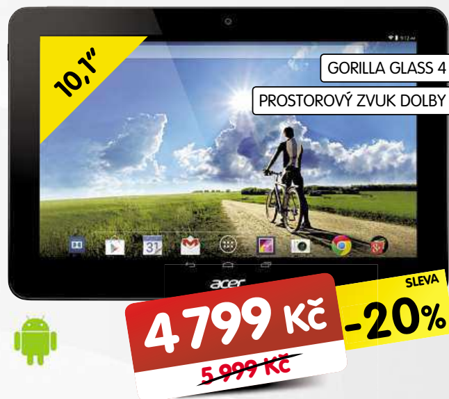
TABLET ACER ICONIA TAB 10 NTL5GEE002 *

• LCD TFT displej • objektiv Nikkor • 2,3" obrazový snímač CMOS • stabilizace obrazu • automatické zaostřování s detekcí kontrastu • automatický záblesk TTL s monitorovacími předzáblesky • USB • PictBridge • konektor audio/ videovýstupu • samospoušť • výstup HDMI • obsah balení - brašna, pouzko, krytka objektivu, kabel USB, 4x AA baterie