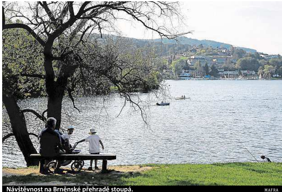
Návštěvnost na Brněnské přehradě stoupá.