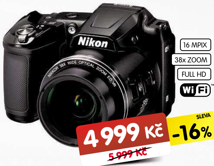
DIGITÁLNÍ FOTOAPARÁT NIKON L840 BLACK/RED + POUZDRO *

• LCD TFT displej • objektiv Nikkor • 2,3" obrazový snímač CMOS • stabilizace obrazu • automatické zaostřování s detekcí kontrastu • automatický záblesk TTL s monitorovacími předzáblesky • USB • PictBridge • konektor audio/ videovýstupu • samospoušť • výstup HDMI • obsah balení - brašna, pouzko, krytka objektivu, kabel USB, 4x AA baterie