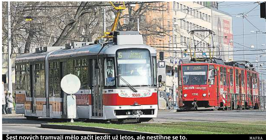
Šest nových tramvají mělo začít jezdit už letos, ale nestihne se to.

Oficiálně se jedná sice o rekonstrukce starých tramvají typu T3 a K2, ale ve skutečnosti vyjede na koleje nové vozidlo, ze starého se využijí jen některé součásti. Na-