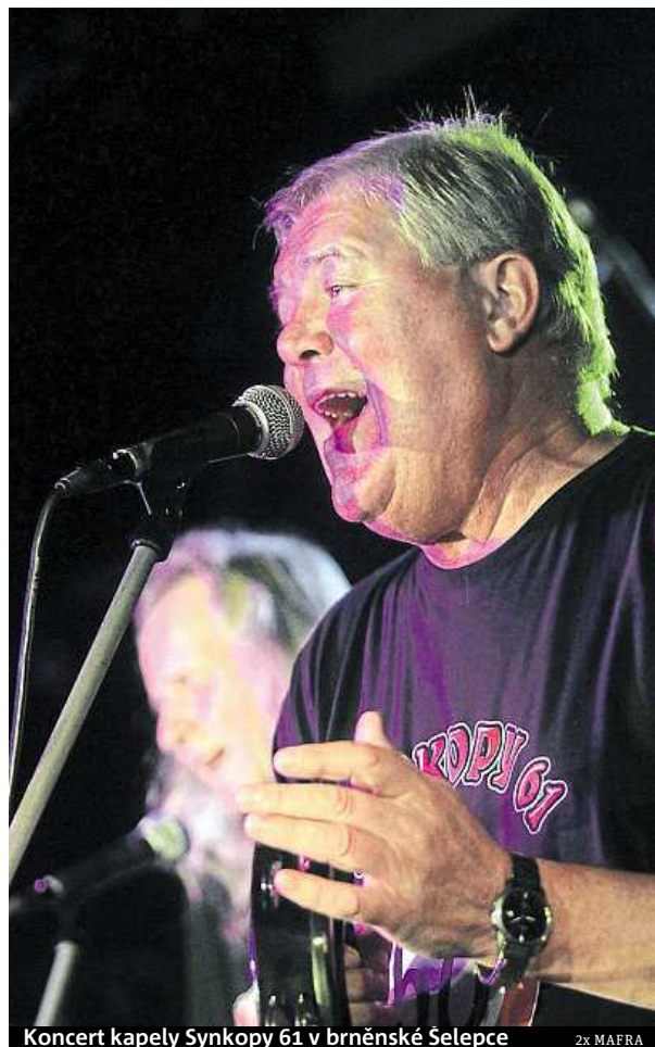
Koncert kapely Synkopy 61 v brněnské Šelepce