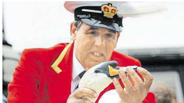
Barber počítá labutě.

Tradice sahá až do 12. století a původně sloužila k tomu,