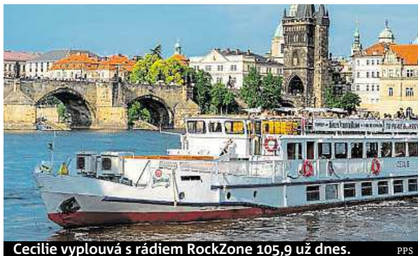
Cecilia vyplouvá s rádiem RockZone 105,9 už dnes. PPS

Už dnes se můžete letos poprvé nalodit na Černý parník rádia RockZone 105,9. Vyplovává v 19 hodin z pražského Rašínova nábřeží a za vstupné 150 korun si můžete užívat mimo jiné i koncertu skupiny Alke-