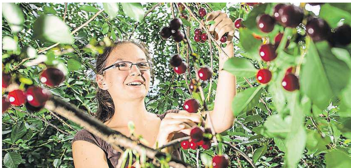
Višní bude dostatek. Letos je úroda totiž výrazně nadprůměrná. Jejich sklizeň už probíhá také v Dolanech na Náchodsku. ČTK

Co propadne státu. Majetek zločinců nebo zemřelých, po nichž chybí dědic. K prodeji. Od akurtačky za pár stovek až po luxusní paláce za miliony. Ostražitost. Je na místě hlavně u koupě nemovitostí STRANA 3