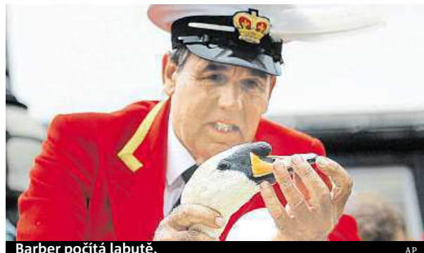
Barber počítá labutě.

Tradice sahá až do 12. století a původně sloužila k tomu,