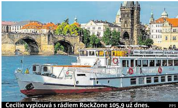
Cecilia vyplouvá s rádiem RockZone 105,9 už dnes. PPS

Už dnes se můžete letos poprvé nalodit na Černý parník rádia RockZone 105,9. Vyplovává v 19 hodin z pražského Rašínova nábřeží a za vstupné 150 korun si můžete užívat mimo jiné i koncertu skupiny Alke-