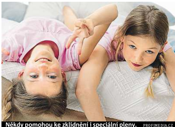
Někdy pomohou ke zklidnění i speciální pleny.

„Pokud se takový problém objeví v souvislosti s pobytem na táboře či na dovolené, nelze vyloučit, že taková zkušenost je pro dítě takzvaným zvršeným adaptačním nárokem. Ten má různé důvody – stres, strach, smutek, změna režimu, kvalita vrstevnic-