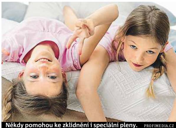
Někdy pomohou ke zklidnění i speciální pleny.

„Pokud se takový problém objeví v souvislosti s pobytem na táboře či na dovolené, nelze vyloučit, že taková zkušenost je pro dítě takzvaným zvršeným adaptačním nárokem. Ten má různé důvody – stres, strach, smutek, změna režimu, kvalita vrstevnic-