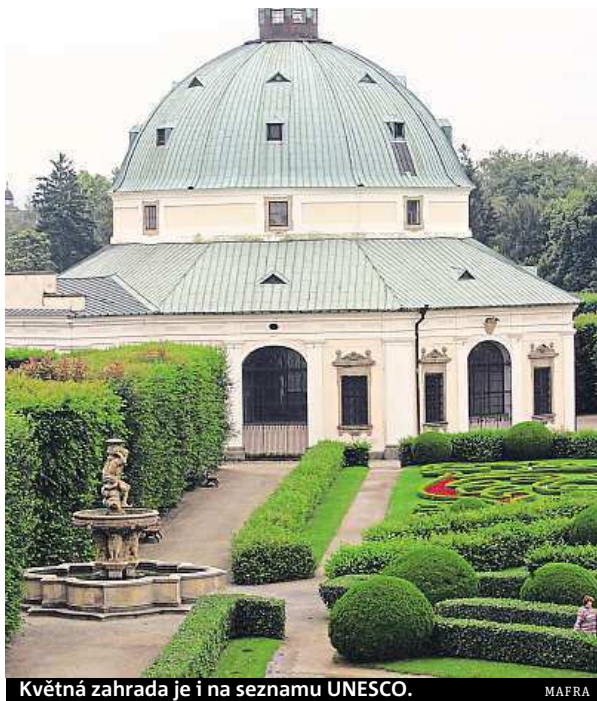
Květná zahrada je i na seznamu UNESCO.

Květná zahrada nebyla po dobu úprav pro návštěvníky uzavřena. Obnova zahrady začala na podzim 2012 a stála 230 milionů korun. ČTK