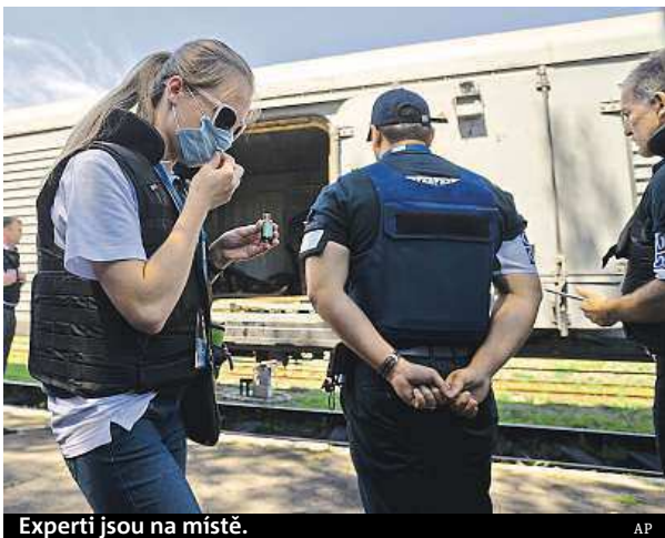
Experti jsou na místě.