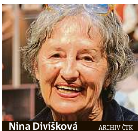
Nina Divišková