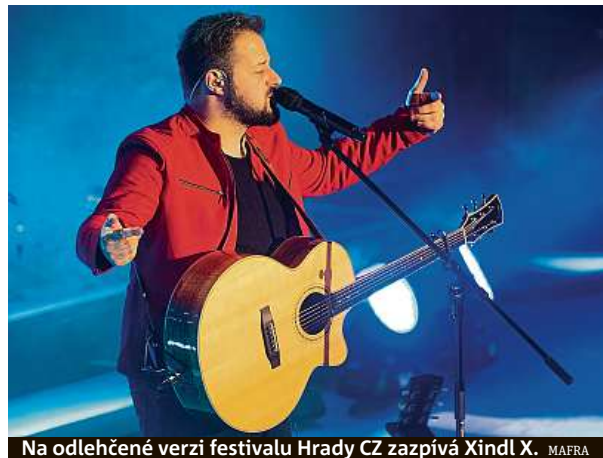
Na odlehčené verzi festivalu Hradů CZ zazpívá Xindl X.