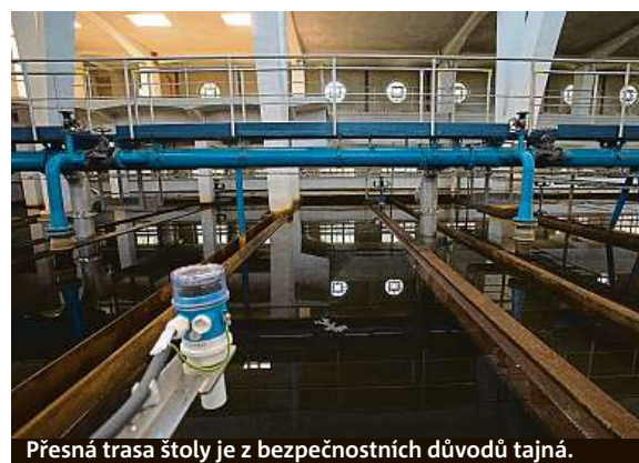
Přesná trasa štol je z bezpečnostních důvodů tajná.

Stavba nového propojení vodárny v Podolí do vodojemu na Floře by mohla začít zhruba za dva roky.