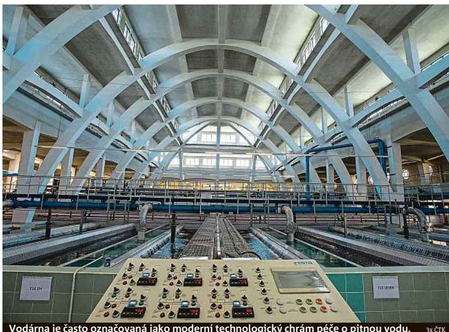
Vodárna je často označovaná jako moderní technologický chrám péče o pitnou vodu.

Vodárna je v podstatě už babička. Její příběh se začal psát v roce 1925, kdy na břehu Vltavy započala stavba objektu podle projektu architektů Antonína Engela. Hoto bylo za čtyři roky. Výkon vodárny tehdy činil 35–40 tisíc kubických metrů vody za jeden den. Objekt byl za dobu existence několikrát vylep-