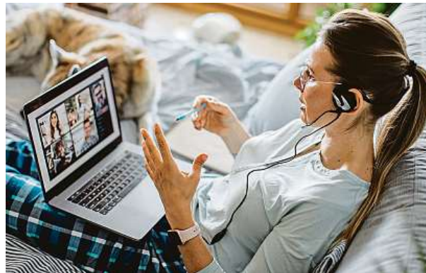
Pyžamový efekt propukl v epidemii naplno.

Téměř polovina z více než tisícovky dotazovaných se přiznala, že když ten den stejně neměla v plánu vidět jiné lidi, neměla dostatečnou motivaci se umýt. Třetina pak uvedla jako hlavní důvod ztrátu dřívějšího pravidelného rytmu. Třináct procent lidí se přestalo sprchovat, když omezilo své sportovní aktivity, a tedy i pocení. Každý desátý Čech přiznal, že během home office prostě zlenivěl. PAVEL HRABICA