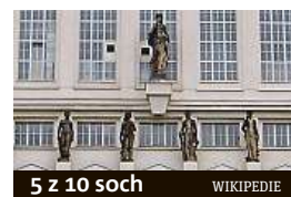
5 z 10 soch WIKIPEDIE