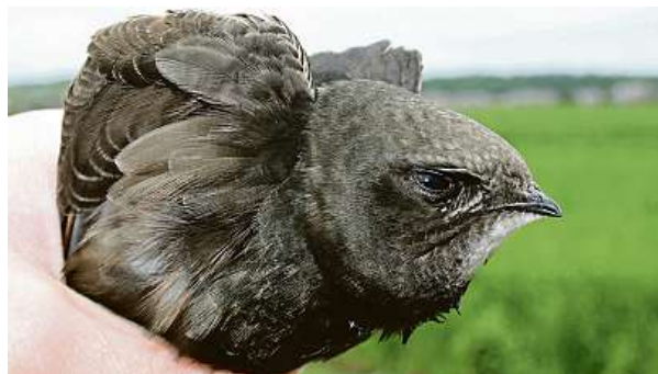
Vyčerpaný rorýs. Zachránit se ho nakonec nepodařilo.

Že přírodní koloběh opravdu funguje, lze podle Nezmeškalové dobře ukázat na příkladu dravců a sov. Kvůli suchu a nedostatku potravy totiž drobní hlodavci odchovávají minimální počet mláďat a v důsledku toho dravci a sovy nemají čím krmit své mladé. Do záchranných stanic určených živočichům se tak dostávají mláďata těchto ptáků dehydrovaná a zcela vy-