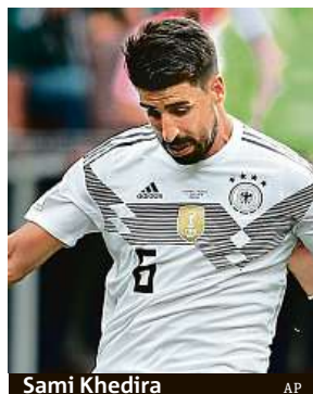
Samir Khedira

Kdyby Němci vypadli už ve skupině, bylo by to poprvé v historii. Pouze v roce 1938 nacistické Německo skončilo v 1. kole, ale tehdy se hned hrálo vyřazovacím systémem.