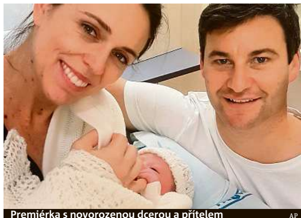
Premiérka s novorozenou dcerou a přítelem

Příštích šest týdnů šéfku vlády zastoupí její náměstek Winston Peters. Premiérka porodila v největší novozélandské státní nemocnici v Aucklandu. Tam s ní byl její partner Clarke Gayford, který později převezme péči