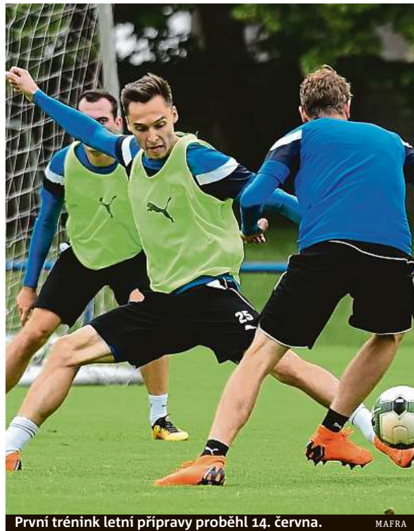
První trénink letní přípravy proběhl 14. června.

Stejně jako v minulém roce nedojde ani letos ke klasické výměně permanentek, jak byli fanoušci dříve zvyklí. Místenkové vstupenky si totiž budou moci ponechat pouze fanoušci, kteří permanentku na konkrétní místo dosud vlastnili. Nově si již místenkovou permanentku nebudou možné zakoupit, proto není potřeba provádět výměnu permanentek, protože nebudou možné jejich místo vykoupit. MET