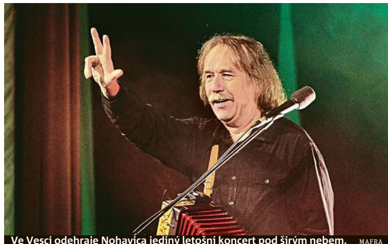
Ve Vesce odehraje Nohavica jediný letošní koncert pod širým nebem.