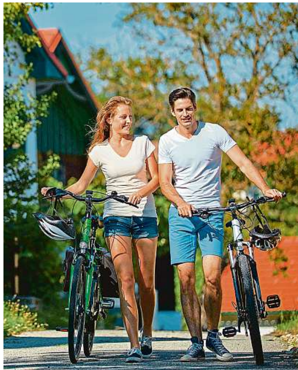
Csarterbert Rad Kellergasse