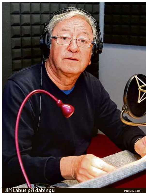
Jiří Lábus při dabingu