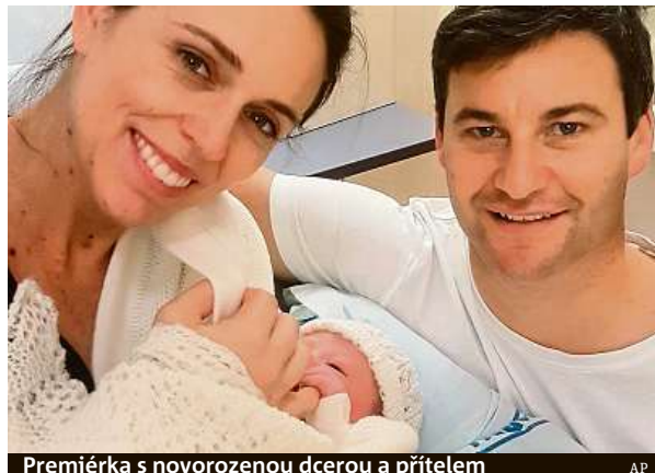
Premiérka s novorozenou dcerou a přítelem