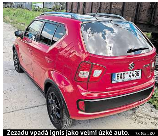
Ze zadu vpadá ignis jako velmi úzké auto. 3x METRO