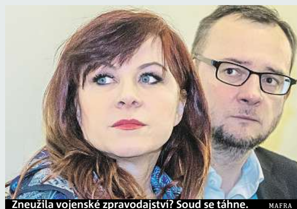
Zneužila vojenské zpravodajství? Soud se táhne. MAFRA