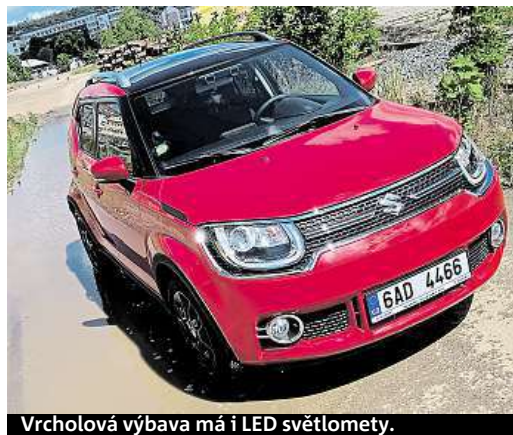
Vrcholová výbava má i LED světlomety.

ní závod tak bude zajišťovat produkci dvou modelů automobilky se zcela elektrickým pohonem, čímž dává najevo, že to s e-mobilitou myslí vážně. Už příští rok totiž začne z jeho montážních linek sjíždět elektrický SUV Audi e-tron. HOŠ