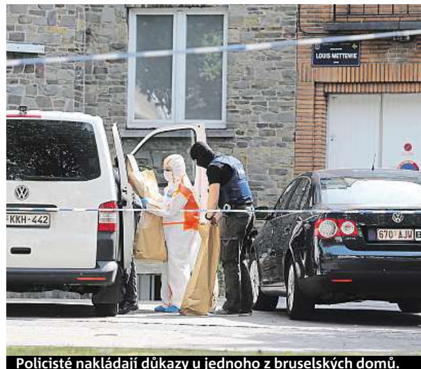
Policisté nakládají důkazy u jednoho z bruselských domů.

O Maročana, který pocházel z nechvalně proslulé bruselské čtvrti Molenbeek, kde žilo i několik pachatelů atentátů z Paříže z roku 2015 a z Bruselu z loňského března, se podle prokuratury tajné služby v minulosti nezajímaly. List La Libre Belgique uvedl, že se Maročan dříve dopustil jen drogových deliktů. K raziím, které se včera v Mo-