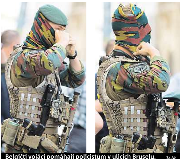
Belgičtí vojáci pomáhají policistům v ulicích Bruselu.

Maročan záutočil před tři čtvrtě na devět večer. Belgická policie v krátké době oznámila, že má situaci na nádraží plně pod kontrolou. Podle prokuratury se muž pokusil odpálit výbušné zařízení, které ale zřejmě selhalo. Ozvala se jen menší rána, po níž se muž rozběhl směrem k vojákům a arabsky křičel Alláhu akbar (Bůh je veliký). „Vojáci reagovali velmi rychle a vel-