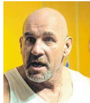
Seriál Pěstírna STREAM.CZ

Firma spustila distribuční label Be2Can Distribution, na kterém prezentuje filmy z festivalů v Berlíně, Benátkách a Cannes. Diváci je uvidí v premiéře stejnojmenného festivalu, v průběhu roku v kinech, televizi, následně i DVD. „Jde o spojení kulturního gesta a ekonomicky zdravého modelu, které přináší