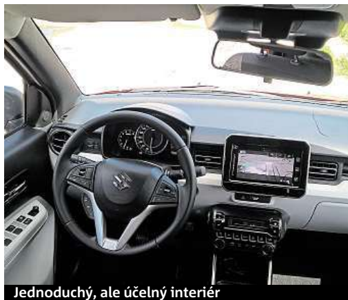
Jednoduchý, ale účelný interiér