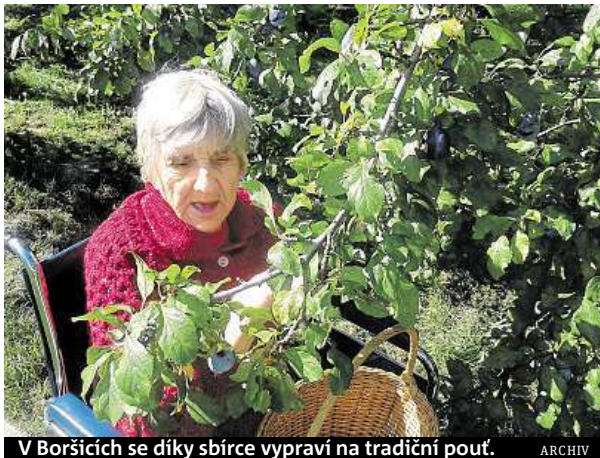
V Boršicích se díky sbírce vypraví na tradiční pouť.

„Na nové pianino bylo potřeba rovných 40 tisíc korun. Na výzvu na stránkách sbírky zareagovalo brzy téměř dva-