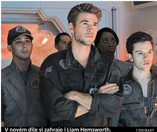
V novém díle si zahraje i Liam Hemsworth.

Fanoušci doufali, že se jednou vrátí. Den nezávislosti před lety nově vymezil žánr katastrofického filmu a jeho další pokračování slibuje velkolepou podívanou. Lidstvo využilo k obraně planety všech prostředků a zdrojů včetně ukořistěné mimozemské technologie. Společným úsilím lidé vyvinuli důmyslný obranný program, který by měl planetu Zemi chránit. Ale nic nemůže lidstvo připravit na moderní a nebývalou sílu z vesmíru. Pouze vynalézavost a důvtip několika odvážných žen a mužů dokáže zachránit svět před zánikem.