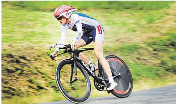
Martina Sáblíková na republikovém šampionátu