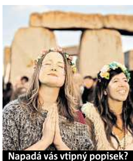
Napadá vás vtipný popisěk?

Napište bublinu a reagujte na sloupek na: www.facebook.com/denikmetro