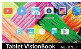
Tablet VisionBook MIRONET

až po výkonné komponenty v čele s procesory Intel, vhodné jak pro kancelářskou práci, tak hry a multimediální zábavu. K některým VisionBookům s operačním systémem Windows 10 navíc dostanete odnímatelnou klávesnici již přímo v balení a můžete si tak během vteřinky přeměnit váš šikový tablet na plnohodnotný notebook. Novinka na trhu VisionBook 10Qi 3G, s operačním systémem Android 5.1, zase disponuje slotem pro vložení SIM karty, jež umožní volání a datové připojení přímo z tabletu.