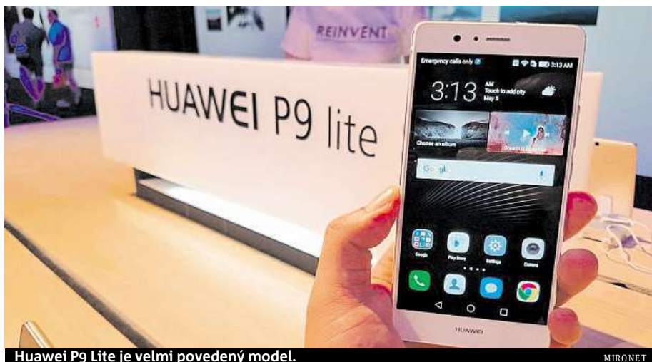
Huawei P9 Lite je velmi povedený model.

První, co vás na Huawei P9 Lite zaujme, je fantastická kvalita displeje, která nemá ve své cenové kategorii obdoby. Vaše oči mohou spočinout na 5.2" IPS displeji s Full HD rozlišením (1920 x 1080 px). Kolem displeje se rozprostírá elegantní, pouze 7,5 mm tenké tělo orámované kovovým rámečkem. O špičkové technologii nebyla ochuzena ani zadní strana telefonu, na níž najdeme rychlou a praktickou čtečku otisků prstů nebo také takřka profesionální 13Mpx fotoaparát. Integrovaný byl snímáči SONY s vynikající světelností f/2.0 pro focení i za zhoršených světelných podmínek. Díky pokročilému režimu focení si můžete pohrát s hodnotou expozice, nastavením ISO nebo vyvážením bílé.