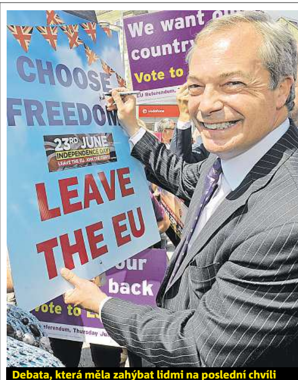
Debata, která měla zahýbat lidmi na poslední chvíli

Nadcházející referendum o budoucnosti Británie v EU bude podle premiéra Davida Camerona životní volbou, po které již nebude možné změnit názor. „Pokud se rozhodneme odejít a když se to brzy ukáže jako velká chyba, nebude již možnost změnit názor.“ upozorňoval Cameron v nedělníku The Sunday Telegraph.