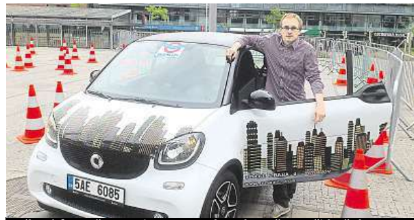
Cílové foto: čas 1 minuta 14 sekund, sražený tři kužely. M.H.

Závodník ze mě asi nebude. Klikatou tratí dlouhou 50 metrů jsem jel skoro minutu. Pomalu, ale jistě jsem dojel do cíle. Všechny kužely zůstaly stát. Když jsem vyrazil na dráhu podruhé, dostal jsem za úkol napsat esemesku ve znění: „Už nikdy nebudu psát SMS při jízdě.“ Včera jsem si vyzkoušel, jaké to je, řídit auto a přitom psát zprávu. S jednou rukou na volantě jsem dojel do cíle o 20 sekund později. Stihl jsem ale napsat všech sedm slov a zprávu odeslat. Bral jsem to