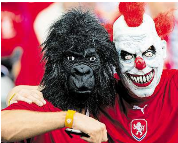
Aspoň před zápasem měli čeští fanoušci dobrou náladu.