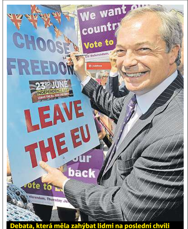
Debata, která měla zahýbat lidmi na poslední chvíli

Nadcházející referendum o budoucnosti Británie v EU bude podle premiéra Davida Camerona životní volbou, po které již nebude možné změnit názor. „Pokud se rozhodneme odejít a když se to brzy ukáže jako velká chyba, nebude již možnost změnit názor,“ upozorňoval Cameron v nedělníku The Sunday Telegraph. DAV a ČTK