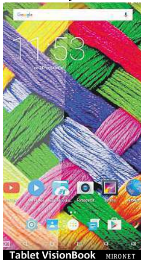
Tablet VisionBook MIRONET

Vyrábí se totiž hned ve čtyřech různých velikostech s úhlopříčkou displeje od 7 až po 11,6". Tím však možnost volby nekončí, vybírat si totiž můžete i mezi operačním systémem Android či Windows.