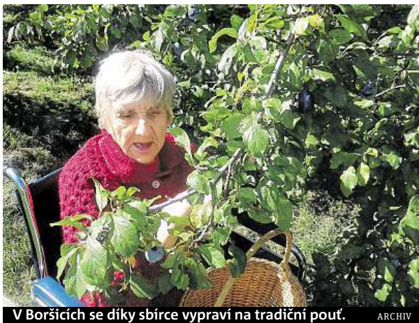
V Boršicích se díky sbírce vypraví na tradiční pouť.

Již 23 přání za více než 700 tisíc korun se podařilo splnit lidem v domovech, klubech a zařízeních pro seniory.