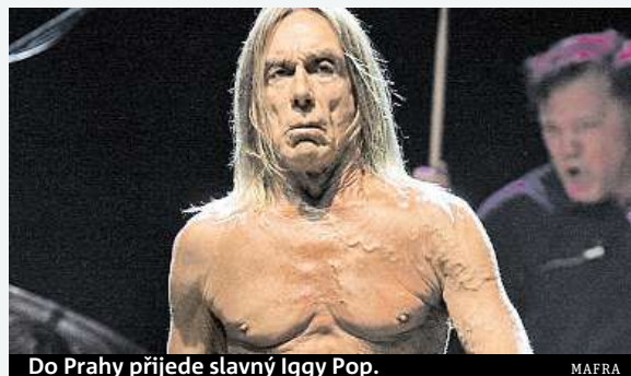
Do Prahy přijede slavný Iggy Pop.

Po vzoru Prahy, kde tisíce lidí míří na náplavky, i Plzeň bude mít na břehu Radbuzy nový tahák pro místní i turisty. Místa pro rekreaci, kulturu a zábavu by se mohla otevřít na jaře 2018. V jedné části náplavky se už akce pořádají – třetím rokem tady působí spolek K světa. IDNES.cz