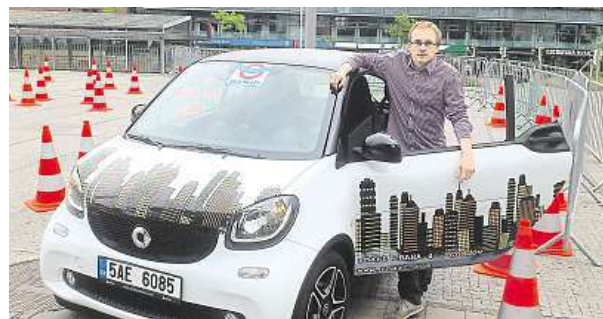
Cílové foto: čas 1 minuta 14 sekund, sražený tři kužely. M.H.

Závodník ze mě asi nebude. Klikatou tratí dlouhou 50 metrů jsem jel skoro minutu. Pomalu, ale jistě jsem dojel do cíle. Všechny kužely zůstaly stát. Když jsem vyrazil na dráhu podruhé, dostal jsem za úkol napsat esemesku ve znění: „Už nikdy nebudu psát SMS při jízdě.“ Včera jsem si vyzkoušel, jaké to je, řídit auto a přitom psát zprávu. S jednou rukou na volantu jsem dojel do cíle o 20 sekund později. Stihl jsem ale napsat všech sedm slov a zprávu odeslat. Bral jsem to