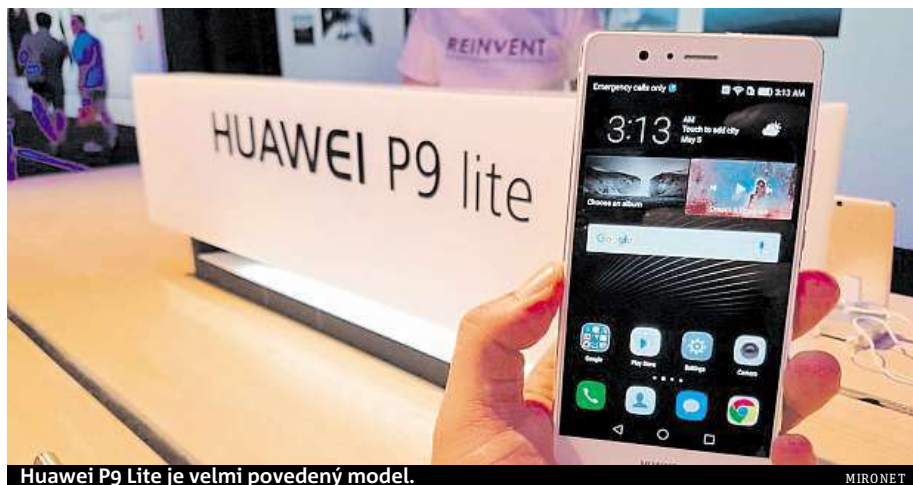
Huawei P9 Lite je velmi povedený model.

Integrovaný byl snímáček SONY s vynikající světelností f/2.0 pro focení i za zhoršených světelných podmínek. Díky pokročilému režimu focení si můžete pohrát s hod-