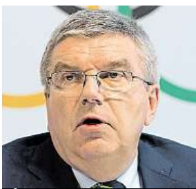
Séf MOV Thomas Bach

„Máme vážné pochybnosti, že sportovci z Ruska i z Keni jsou čisti,“ stojí v prohlášení MOV. Ten vyzval Světovou antidopingovou agenturu, aby příští rok uspořádala konferenci, na které reviduje celý antidopingový systém. Ruští sportovci nezátížení dopingem se odvolávají k arbitráži.