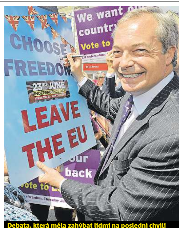
Debata, která měla zahýbat lidmi na poslední chvíli

Nadcházející referendum o budoucnosti Británie v EU bude podle premiéra Davida Camerona životní volbou, po které již nebude možné změnit názor. „Pokud se rozhodneme odejít a když se to brzy ukáže jako velká chyba, nebude již možnost změnit názor.“ upozorňoval Cameron v nedělníku The Sunday Telegraph. DAV a ČTK