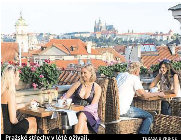
Pražské střešky v létě ožívají.

Na střeše libeňského obchodního centra Harfa můžete zase vyrazit s dětmi na dětské hřiště, navštívit fitness či zajít společně prozkoumat taje prehistorických dinosaurů. „V dinoparku najdete jak