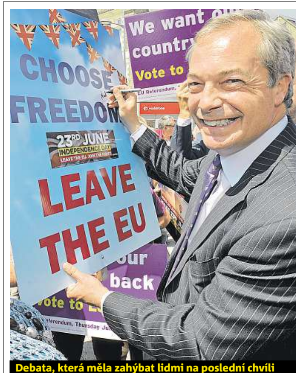
Debata, která měla zahýbat lidmi na poslední chvíli

Nadcházející referendum o budoucnosti Británie v EU bude podle premiéra Davida Camerona životní volbou, po které již nebude možné změnit názor. „Pokud se rozhodneme odejít a když se to brzy ukáže jako velká chyba, nebude již možnost změnit názor,“ upozorňoval Cameron v nedělníku The Sunday Telegraph. DAV a ČTK