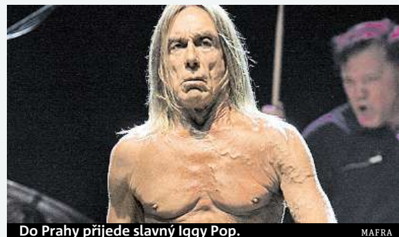
Do Prahy přijede slavný Iggy Pop.

Po vzoru Prahy, kde tisíce lidí míří na náplavky, i Plzeň bude mít na břehu Radbuzy nový tahák pro místní i turisty. Místa pro rekreaci, kulturu a zábavu by se mohla otevřít na jaře 2018. V jedné části náplavky se už akce pořádají – třetím rokem tady působí spolek K světa.