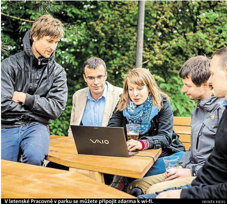
V letenské Pracovně v parku se můžete připojit zdarma k wi-fi.

Jestliže vám kavárenské prostředí vyhovuje, můžete se s učivem uchýlit také do Literární kavárny v Řetězové, Týnské či Salmovské ulici, kde je zejména přes den dostatek klidu. V případě, že k učení nepotřebujete zrov-