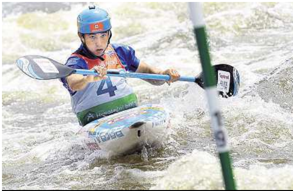
Dvojnásobný mistr Evropy Jiří Prskavec na trati v Troji

Jiří Prskavec svou disciplínu vyhrál, i když až po diskvalifikaci soupeře.