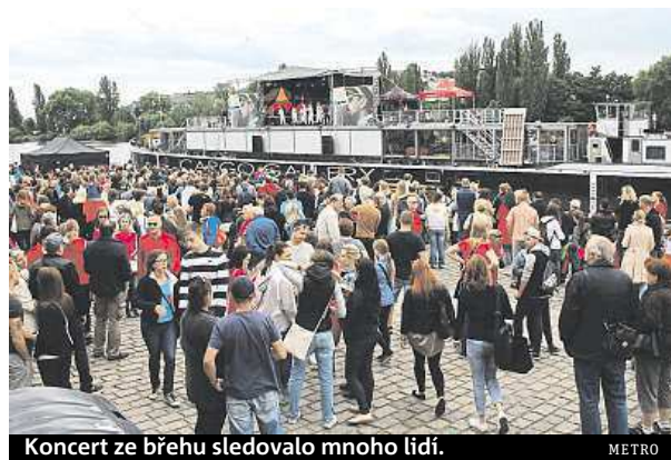
Koncert ze břehu sledovalo mnoho lidí. METRO