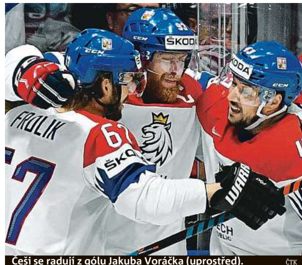
Češi se radují z gólu Jakuba Voráčka (uprostřed).

Kapitán Jakub Voráček, který v zápase posbíral celkem tři kanadské body, ví, že výkon nebyl úplně dokonalý. „Ve třetí třetině v sobě našli Švýcaři ještě jeden stupeň, rozjždli se a začali po nás lítat ještě víc než celý zápas předtím. Myslím si, že od desáté minuty jsme byli lepším týmem až do konce druhé části. Pak na nás začali všechno sypat a bohužel jsme se trochu víc stáhli. Na to si musíme dát pozor, to se nám může vymstít,“ varoval Voráček.