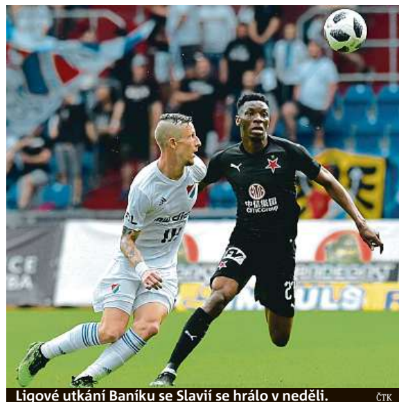
Ligové utkání Baníku se Slavií se hrálo v neděli.

Slávisté očekávají ještě těžší zápas než v neděli v Os-