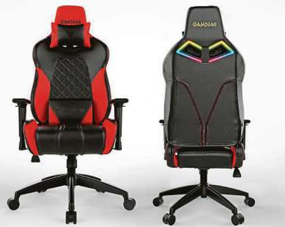
Stylová herní židle

Gamdias Achilles E1 je zkrátka stylová herní židle, ve které je radost sedět. V e-shopu Mironet ji můžete mít už za 5220 korun.