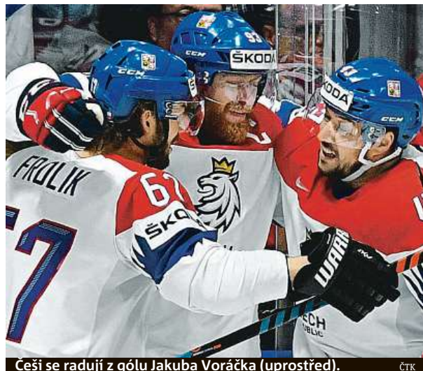
Češi se radují z gólu Jakuba Voráčka (uprostřed).

Kapitán Jakub Voráček, který v zápase posbíral celkem tři kanadské body, ví, že výkon nebyl úplně dokonalý. „Ve třetí třetině v sobě našli Švýcaři ještě jeden stupeň, rozjždli se a začali po nás lítat ještě víc než celý zápas předtím. Myslím si, že od desáté minuty jsme byli lepším týmem až do konce druhé části. Pak na nás začali všechno sypat a bohužel jsme se trochu víc stáhli. Na to si musíme dát pozor, to se nám může vymstít,“ varoval Voráček.