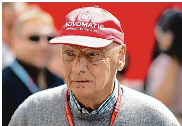
Niki Lauda v roce 2018