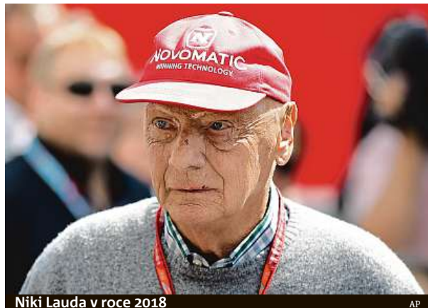
Niki Lauda v roce 2018

Branky: 13. Voráček, 21. Simon, 27. Frolík, 29. Kubalík, 59. Rutta – 27. a 42. Siederwey, 3. Frick, 57. Niederreiter Diváci: 9085