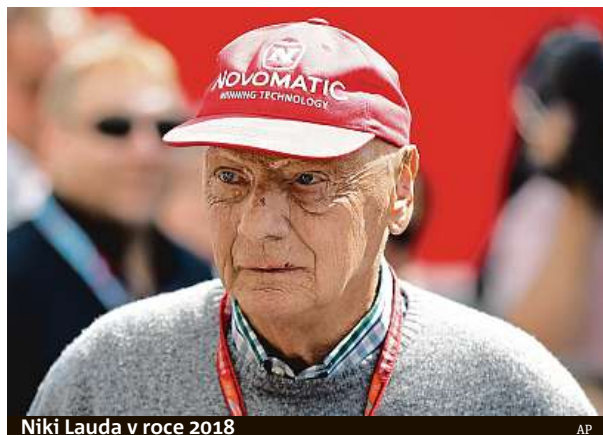
Niki Lauda v roce 2018