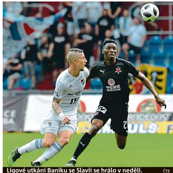
Ligové utkání Baníku se Slavií se hrálo v neděli.

Slávisté očekávají ještě těžší zápas než v neděli v Os-