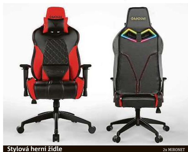
Stylová herní židle

Gamdias Achilles E1 je zkrátka stylová herní židle, ve které je radost sedět. V e-shopu Mironet ji můžete mít už za 5220 korun.