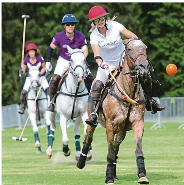
Vznešený sport po širokou veřejnost