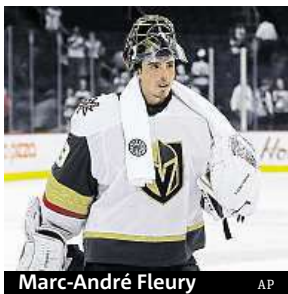
Marc-André Fleury

Las Vegas si každý spojí spíše se zábavou, hazardem