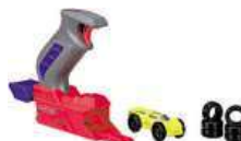
Nerf Nitro Throttleshot Blitz