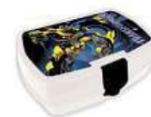
Transformers krabička na svačinu