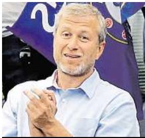
Roman Abramovič

Poslanci vyzvali britskou premiérku, aby bojovala s ruskými špinavými penězi.