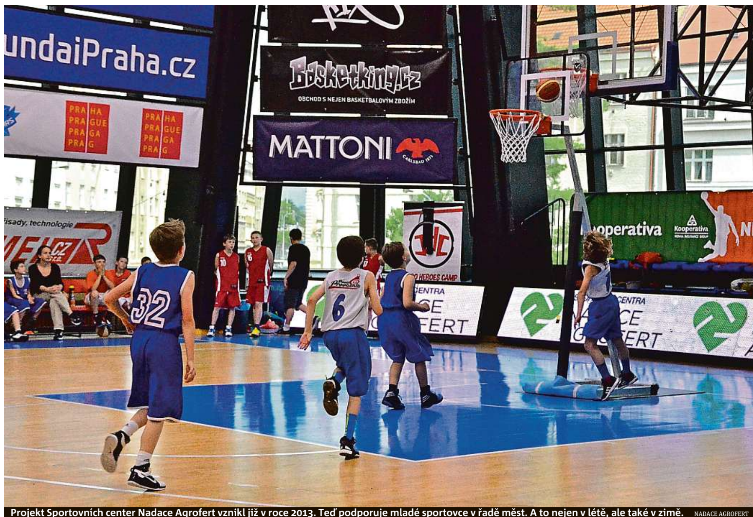
Projekt Sportovních center Nadace Agrofert vznikl již v roce 2013. Teď podporuje mladé sportovce v řadě měst. A to nejen v létě, ale také v zimě. NADACE AGROFERT