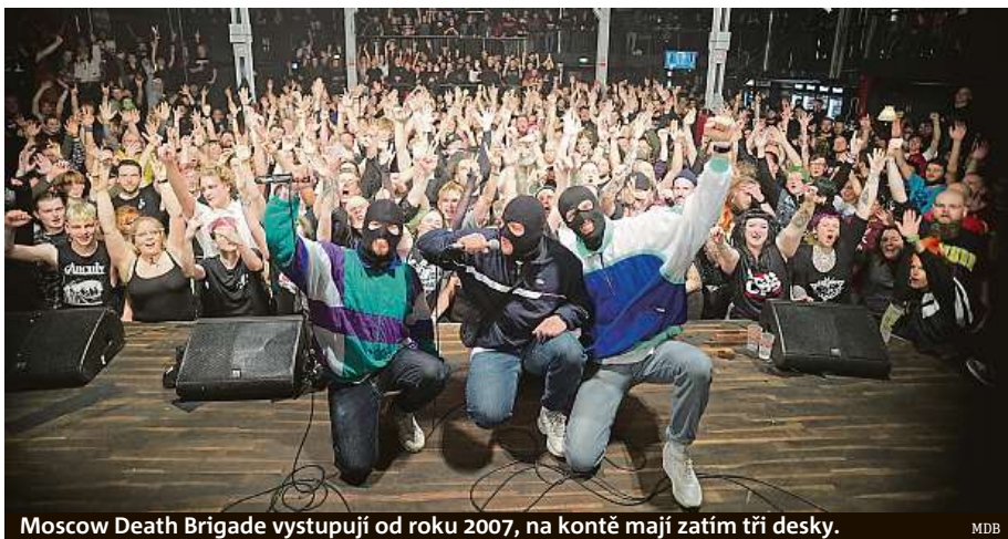
Moscow Death Brigade vystupují od roku 2007, na kontě mají zatím tři desky. MDB

Těžko mluvit za všechny, ale podle lidí, které známe – většina má přátele nebo příbuzné na Ukrajině, takže jsou samozřejmě zdrceni. Mnoho lidí nedostává zprávy z oficiálních provládních médií, ale přímo ze zpráv WhatsApp od lidí, kteří skutečně uvízli ve válečné zóně. Mýtus šířený ruskými a západními médii, že většina Rusů zjevně podporuje invazi, je pravděpodobně nesmysl. Spousta lidí v Rusku protestuje proti válce, připojují se k masovým pouličním protestům nebo vyjadřují své protiválečné názory jiným