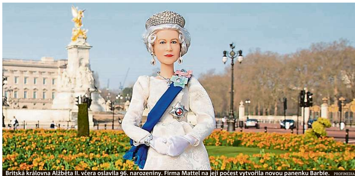
Britská královna Alžběta II. včera oslavila 96. narozeniny. Firma Mattel na její počest vytvořila novou panenku Barbie.

Úspěchy. Velká výzva byl tenisový Laver Cup. Hokej. Sparta má přednost, v říjnu tu opět bude NHL STRANY 10, 17