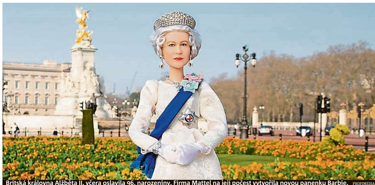
Britská královna Alžběta II. včera oslavila 96. narozeniny. Firma Mattel na její počest vytvořila novou panenku Barbie.

Úspěchy. Velká výzva byl tenisový Laver Cup. Hokej. Sparta má přednost, v říjnu tu opět bude NHL STRANY 10, 17