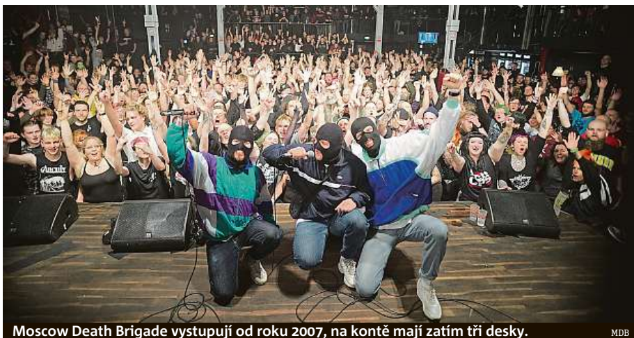
Moscow Death Brigade vystupují od roku 2007, na kontě mají zatím tři desky. MDB

Těžko mluvit za všechny, ale podle lidí, které známe – většina má přátele nebo příbuzné na Ukrajině, takže jsou samozřejmě zdrceni. Mnoho lidí nedostává zprávy z oficiálních provládních médií, ale přímo ze zpráv WhatsApp od lidí, kteří skutečně uvízli ve válečné zóně. Mýtus šířený ruskými a západními médii, že většina Rusů zjevně podporuje invazi, je pravděpodobně nesmysl. Spousta lidí v Rusku protestuje proti válce, připojují se k masovým pouličním protestům nebo vyjadřují své protiválečné názory jiným