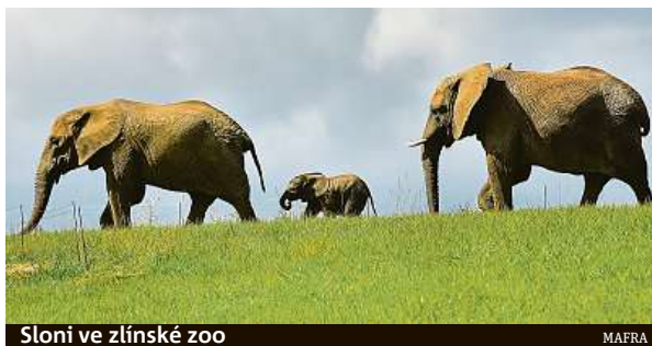
Sloni ve zlínské zoo

Ve voliére budou moci návštěvníci obdivovat orly korunkaté. Jejich původní voliéra se stane novým domovem pro zoborožce kaferské. Výstavbu druhé etapy, chovné-