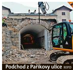
Podchod z Paříkovy ulice ROPID

radnice Prahy 9 předběžně naplánovala zřídit malý výstavní prostor. „Nový podchod z Paříkovy ulice, který bude sloužit cestujícím, se vybuduje o šest metrů vedle stávajícího. Další podchod pak bude z ulic Krátkého a Bratří Dohalských,“ dodává pro Metro Friebová s tím, že se nová stavba z praktických důvodů