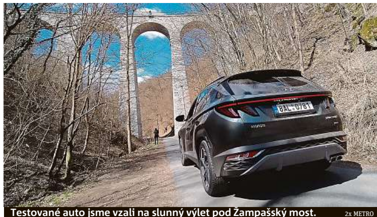
Testované auto jsme vzali na slunný výlet pod Žampašský most.