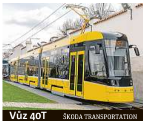
Vůz 40T ŠKODA TRANSPORTATION