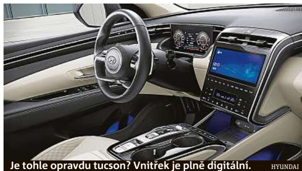
Je tohle opravdu tucson? Vnitřek je plně digitální.

Potěší, že ve standardní výbavě je plno zajímavých položek: osmnáctipalcová kola, vyhřívaný volant a přední sedadla, třízónová klimatizace,