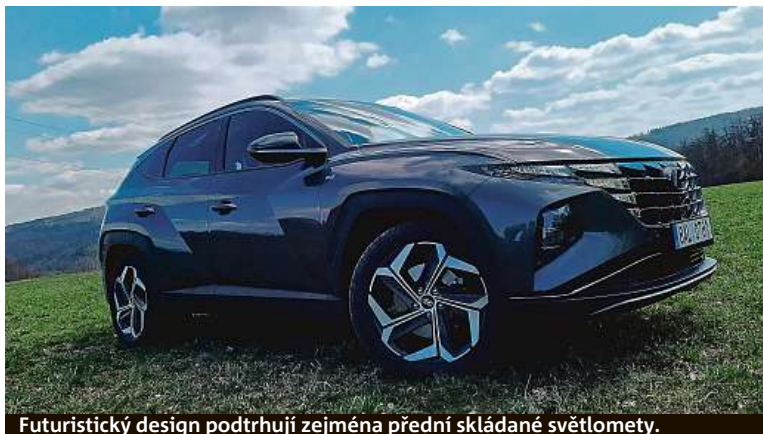
Futuristický design podtrhují zejména přední skládané světlomety.