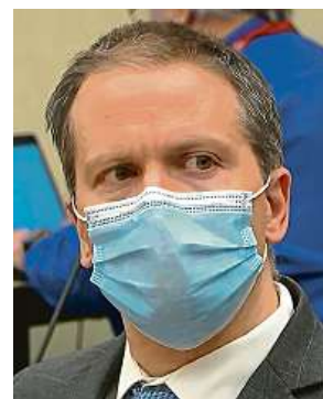
Chauvin vyslechl verdikt.

Prezident Joe Biden označil verdikt poroty za velký krok kupředu. Doplnil však, že podobné rozsudky v zemi, která se potýká se systémovým rasismem, přicházejí jen velmi zřídka. ČTK