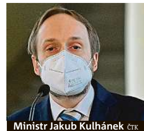
Ministr Jakub Kulhánek ČTK

etapy, není to však vina České republiky,“ uvedl Kulhánek při svém jmenování. Na twitteru v pondělí napsal, že hovořil s generálním tajemníkem Severoatlantické aliance (NATO) Jensem Stoltenbergem. Poděkoval mu za podporu ve složitých časech. ČTK