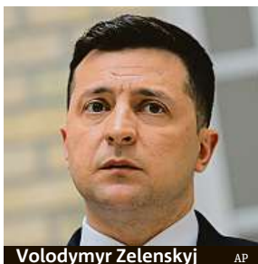
Volodymyr Zelenskyj

Zatímco ukrajinský prezident Volodymyr Zelenskyj marně tlačí na jednání v rám-