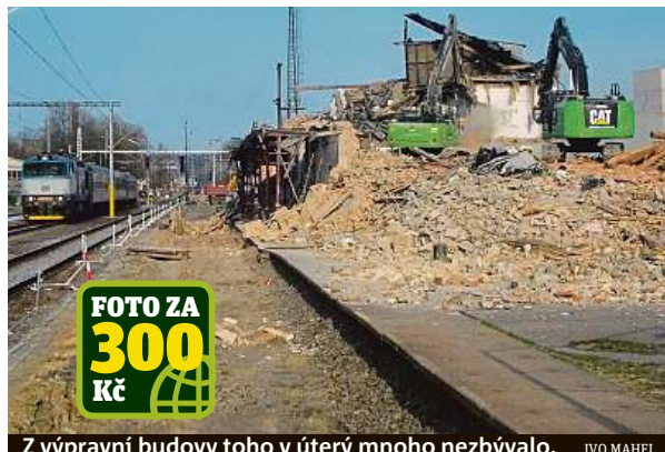
Z výpravní budovy toho v úterý mnoho nezbyvalo. IVO MAHEL

Podle původních návrhů měl být podchod s nejstarší dochovanou dlažbou na území vnější Prahy v rámci plánované rekonstrukce zasypan a zapomenut. Nesplňoval totiž současné bezpečnostní normy. Nyní si v něm