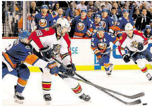
Jaromír Jágr se statečně pere v play-off NHL.

Jágr na vlastní střelecký půst nehledí a soustředí se jen na boj o Stanleyův pohár, který získal v letech 1991 a 1992 s Pittsburghem. „Pamatujete si, kdo dával góly před deseti lety? Já si ani nevzpomenu, kdo vyhrál pohár. Koho mé góly zajímají? Chci pomoci. Dal jsem spoustu gólů. I když už žádný nedám, tak budu se svou hokejovou kariérou spokojený. Nijak mě to netrápí,“ řekl Jágr serveru nhl.com.