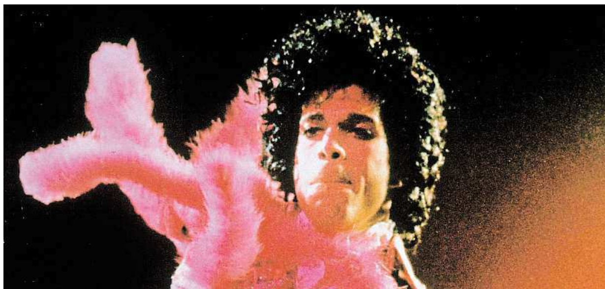
Ve věku 57 let včera zemřel americký zpěvák a multiinstrumentalista Prince (na snímku z roku 1985).

Leden 2018. Za rok a půl mají doktoři povinně vydávat recepty elektronicky. Výhody. To může lékařům i pacientům ušetřit čas. Realita. Systém ale umí málo, e-recepty tak vydává pouze 6 procent doktorů STRANA 2