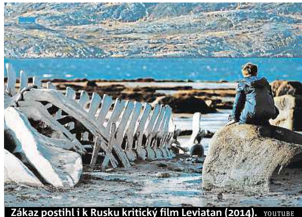
Zákaz postihl i k Rusku kritický film Leviatan (2014). YOUTUBE

Zákaz se vztahuje také na všechny popularizační a propagandistické filmy natočené po 1. srpnu 1991, kdy se začínal rozpadat Sovětský svaz, a to bez ohledu na zemi výroby. V případě snímků neobsahujících popularizaci či propagandu se zákaz podle listu nové týká i „vysílání filmů vytvořených fyzickými či právníckými osobami státu-agresora po 1. lednu 2014“. Zákon má