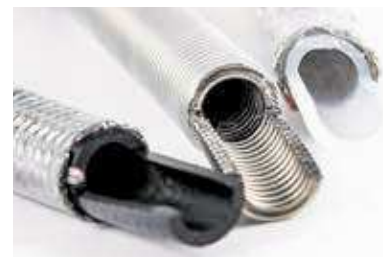
Řez vodovodními hadičkami, zleva: z pryže, z nerezové oceli (hadička Flexira), ze silikonu

až 1500 litrů vody za hodinu. Pojišťovny evidují ročně přes 35 tisíc vodovodních škod. Pokud chcete svou domácnost ochránit před nečekaným vytopením, pořídte si hadičky Flexira od AZ-Pokorný vyrobené pouze z chirurgické oceli. Jde o jednorázovou investici, která ochrání vaši domácnost více než 100 let, chirurgická ocel vám zároveň garantuje 100% zdravotní nezávadnost. Hadičky Flexira můžete pořídít v prodejnách Datart. Ten také prodává speciální přípojovací plynové hadice s bajonetovým uzávěrem, díky němuž můžete sami bezpečně uzavřít přívod plynu a sporák odsunout. Lehce tak zvládnete jarní úklid i na jinak špatně dostupném místě za kuchyňskou linkou.