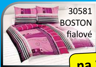
30581 BOSTON fialové