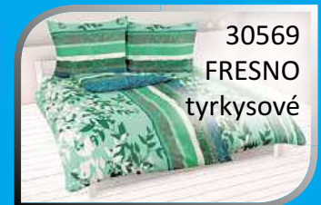
30569 FRESNO tyrkysové