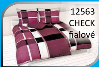
12563 CHECK fialové