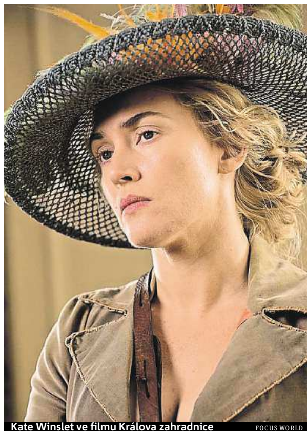
Kate Winslet ve filmu Králova zahradnice

Chce, aby byl každý v pohodě, aby na place nepanoval stres, což se mu také povedlo. A je to výborný organizátor. Což je dobré u každého filmu, ale v tomto konkrétním případě to moc pomohlo, na natáčení jsme totiž měli jen osm týdnů. Navíc v případě historické