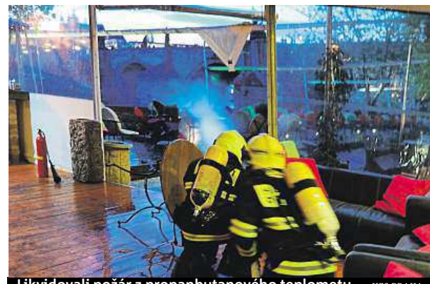
Likvidovali požár z propanbutanového teplometu. HZS PRAHA