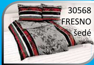
30568 FRESNO šedé