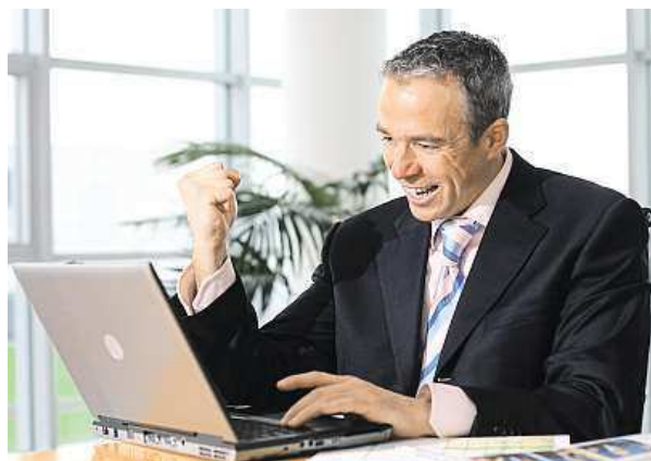
Korupce je ve východní Evropě pořád problém.

Regionální průzkum realizovaný společností Target ve spolupráci s GfK a CEU Business School navazuje na studii z roku 2009 a v mnoha aspektech potvrzuje zlepšení hodnocení.