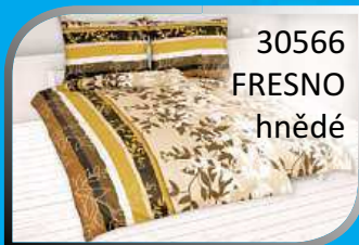
30566 FRESNO hnědé