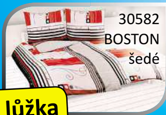
30582 BOSTON šedé