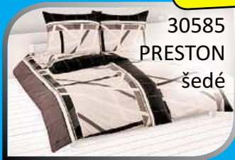
30585 PRESTON šedé