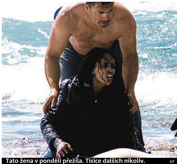
Tato žena v pondělí přežila. Tisíce dalších nikoliv.

Abbottova vláda posílá lodě zpět na místa, odkud vypluly. Všem běžencům, kteří se do Austrálie dostali na lodích, navíc znemožňuje se v zemi natrvalo usadit. Zadržuje je v táborech na ostrově Nauru nebo v Papui-Nové Guineji. Mohou se pak buď vrátit do vlasti, žít trvale v uprchlickém táboře, nebo se usídlit v Kambodži.