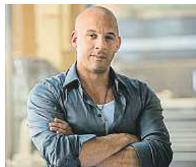
Rychle a zběsile CINEMART

Americký akční snímek Rychle a zběsile 7 se už potřetí umístil v čele žebříčku nejnavštěvovanějších filmů českých kin. O víkendu ho zhlédlo dalších 26 804 diváků, celkem jich má na kontě více než 237 tisíc a tržby 33 milionů korun. Podle informací Unie filmových distributorů patří druhé místo jako před týdnem britské animované komedii Ovečka Shaun . Tu zhlédlo 13 499 lidí. Třetí příčku obsadil americký animovaný příběh nazvaný Konečně doma . Vypráví o mimozemských vetřelcích, kteří hledají novou planetu, kde by mohli v klidu a míru žít. čTK