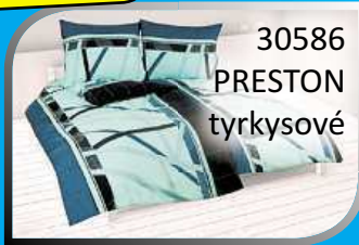
30586 PRESTON tyrkysové