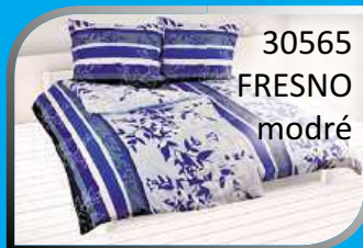
30565 FRESNO modré