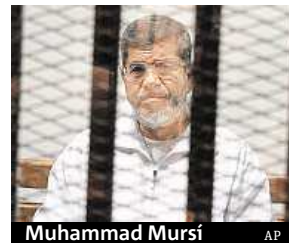
Muhammad Mursí

Bývalého egyptského prezidenta Muhammada Mursího poslal soud v Káhiře na dva deset let do vězení za podněcování k násilí při protivládních protestech v prosinci 2012. Hrozil mu přitom až trest smrti. Proti rozsudku se lze odvolat. ČTK