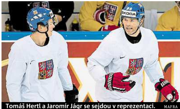
Tomáš Hertl a Jaromír Jágr se sejdou v reprezentaci.

Už minulý týden při přípravných zápasech ve Švédsku naskočil do české sestavy ze zámořské soutěže obránce Michal Jordán. Další hráči z NHL se představí dnes proti Finům. Konkrétně jde o čtveřici Jan Hejda, Jakub Voráček, Martin Erat a Tomáš Hertl.