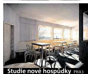
Studie nové hospůdky PHA3