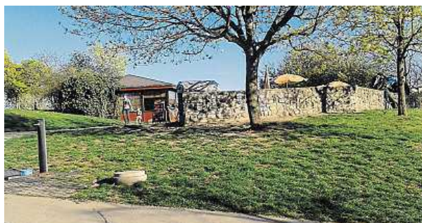
Podél opěrné zidky se postaví nový podnik. D. MOKŘÍŽOVÁ