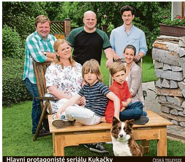
Hlavní protagonisté seriálu Kukačky