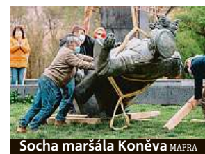
Socha maršála Koněva