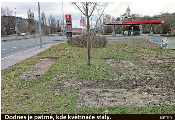
Dodnes je patrné, kde květináče stály.

Praha 5 se dlouhou dobu květináčů nemohla zbavit, protože na projekt získala evropskou dotaci. Ta byla vážná takzvanou udržitelností, což je doba, po kterou musí příjemce evropských dotací udržet výsledky projektu, po-