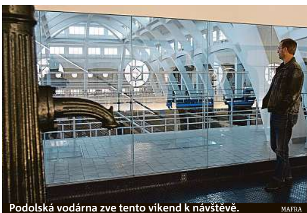
Podolská vodárna zve tento víkend k návštěvě.

Hodně vody proteče v průmyslu, ale také přes nejrůznější servis, který poskytuje každé město. V létě se jedná například o kropení ulic, jež snižuje přízemní ozon v ulicích, omezuje výrazné prašnost a celkově upravuje mikroklima ve městech. „Kropení-mlžení se musí provádět