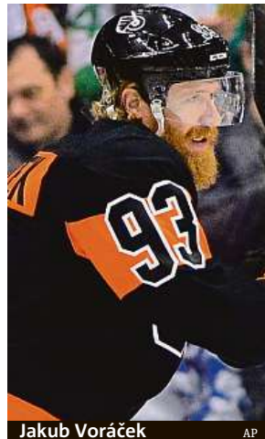
Jakub Voráček

„Bude to další velká etapa mé hokejové kariéry. Člověk si říká, že by se to někdy mohlo stát, přeje si to, ale že se to jednou opravdu povede, asi moc nepočítá. Zahrát si v Praze před českými fanoušky bude něco unikátního,“ řekl pro nhl.com/cs Voráček.