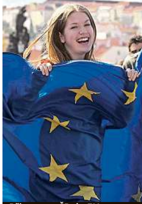
Při vstupu ČR do EU MAFRA

ment, nové strany nepatří mezi favority voleb. Těmi jsou ANO se ziskem osmi mandátů, druzí Piráti získají podle projekce čtyři křesla a třetí ODS tři. Česko v Evropském parlamentu zastupuje 21 poslanců. MAREK HÝŘ