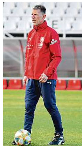
Jaroslav Šilhavý ČTK

„Chtěli bychom setrvat u toho, co jsme hráli na podzim, i když tam asi teď bude ve větší míře zastoupená defenziva. Ale jen bránit se devadesát minut nejde ani proti Anglii. Jsou to výjimečné zápasy a takové vyžadují výjimečné výkony. Pokud je podáme, máme šanci uspět,“ řekl Šilhavý a dodal: „Na mistrovství světa hrála