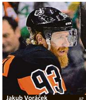
Jakub Voráček

Nová sezona zámořské hokejové ligy začne v říjnu v O2 areně soubojem Philadelphie s Chicagem.