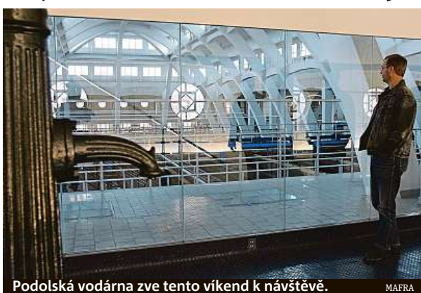
Podolská vodárna zve tento víkend k návštěvě.

Hodně vody proteče v průmyslu, ale také přes nejrůznější servis, který poskytuje každé město. V létě se jedná například o kropení ulic, jež snižuje přízemní ozon v ulicích, omezuje výrazné prašnost a celkově upravuje mikroklima ve městech. „Kropení-mlžení se musí provádět