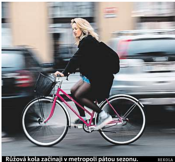
Růžová kola začínají v metropoli pátou sezónu.

Od včera je v provozu prvních sto kol. Jejich počet bude narůstat podle vývoje počasí. Podle Ježka je v plánu vypustit v Praze do provozu 450 kol. ROW