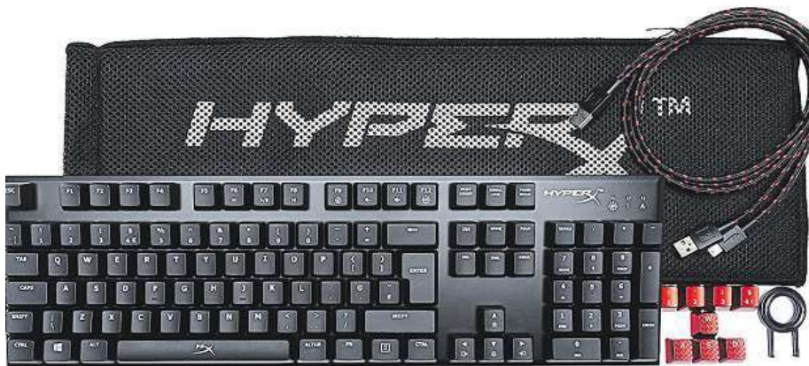
Specializovaná herní klávesnice HyperX Alloy FPS

Skvělá mechanická klávesnice HyperX Alloy FPS je stabilní, má podsvícení se šesti efekty a speciálním herním módem pro zamknutí tlačítka Windows.