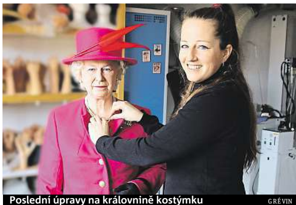
Poslední úpravy na královnině kostýmku

Lidé se s královnou Alžbětou II. budou moct na náměstí ve speciálním stanu také vyfotografovat.