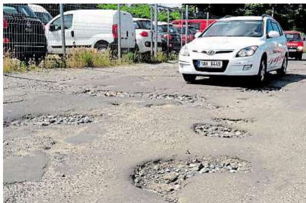
Silnice, nebo tankodrom? To je ulice U Seřadiště. VÝMOLY.CZ