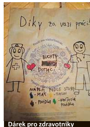
Dárek pro zdravotníky