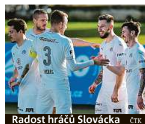
Radost hráčů Slovácka

Vrby, tentokrát uspěla ve Zlíně poměrem 3:0. Venku se dařilo také Slovácku, které už je po výhře 4:1 v Příbrami v tabulce třetí. Na Příbram se bodově dotáhla poslední Opava, která vyhrála 1:0 v Českých Budějovicích. Duel Teplic s vedoucí Slavií skončil až po uzávěrci tohoto vydání. PUR