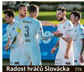
Radost hráčů Slovácka

Vrby, tentokrát uspěla ve Zlíně poměrem 3:0. Venku se dařilo také Slovácku, které už je po výhře 4:1 v Příbrami v tabulce třetí. Na Příbram se bodově dotáhla poslední Opava, která vyhrála 1:0 v Českých Budějovicích. Duel Teplic s vedoucí Slavií skončil až po uzávěrci tohoto vydání. PUR