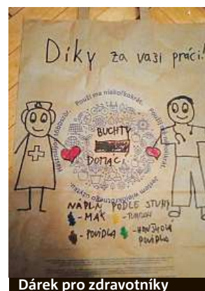
Dárek pro zdravotníky