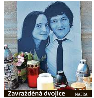
Zavražděná dvojice

Soud první instance při zdůvodnění svého verdiktu uvedl, že nebyl předložen žádný přímý důkaz, který by Kočnera usvědčoval z objednání Kuciakovy vraždy. Prokuratura tvrdila, že Kočner si objednal Kuciakovu vraždu