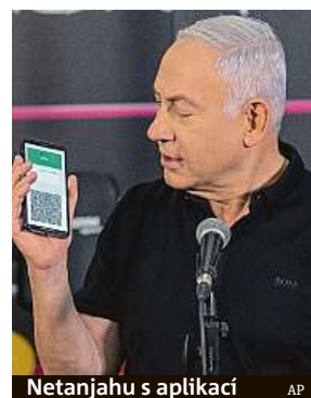
Netanjahu s aplikací

Pokud jde o rychlost očkování proti covidu-19, je Izrael jednou z nejuspěšnějších zemí na světě. Zhruba devítimilionová země dosud alespoň jednou dávkou naočkovala přibližně 45 procent popu-