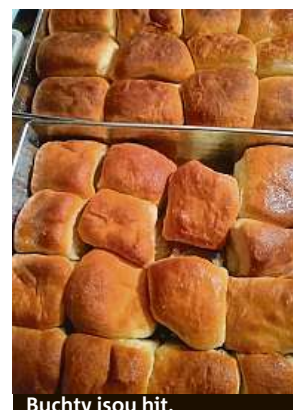
Buchty jsou hit.

Noviny nejsou nafukovací, a proto se nám do článku již nepodařilo vměstnat nic z několika stovek poděkování a chvalo zpěvů, které lze na adresu práce Schreiberové dohledat na internetu. Pro jistotu jsme paní Zuzanu varovali, že po vydání článku její věhlas ještě vzroste. Prý je připravena a uvažuje i o něčem na způsob objednávkového formuláře. FILIP JAROŠEVSKÝ