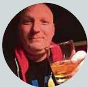
Tom Vlč Tak spíše co má vláda za plány.