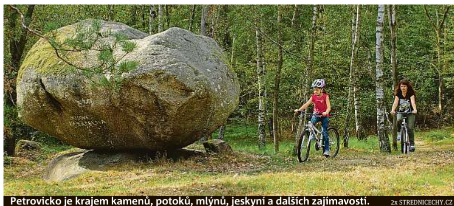
Petrovicko je krajem kamenů, potoků, mlýnů, jeskyní a dalších zajímavostí.