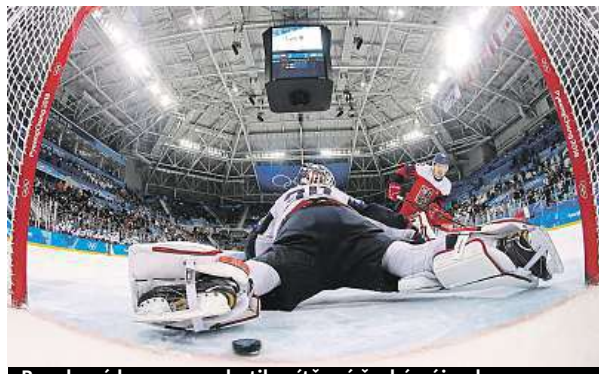
Branková kamera zachytila vítězný český nájezd.

Jako malý snil o tom, že jednou pomůže týmu stejně jako Dominik Hašek v Naganu. „Přemýšlel jsem nad tím, než začaly nájezdy. Říkal jsem si, že přesně na tohle jsme si hráli jako malí kluci za barákem při nájezdech. Přišlo mi to neuvěřitelné. Je to super pocit. Jsem šťastný za vítězství,“ prohlásil šťastný gólman Francouz.