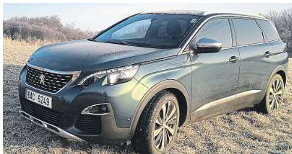
Otestovali jsme Peugeot 5008.

Přednosti velkého vysokého auta ocení rodina na zimní dovolené každý den. Navzdory terénnímu vzhledu sice nedostanete pohon všech kol – je tu pouze systém ESP naladěný tak, aby rozpoznal typ povrchu a uzpůsobil tomu trakci – ale na sněhu ani ledu jsme neměli s manévrováním peugeotu problémy. Otázkou je, jak by se auto chovalo například na rozbahněné lesní cestě. V tomhle má škodovka se čtyřkolovou navrch. Když bychom chtěli na lyže vzít další dvě děti, nebyl by to problém – další dvě sedadla složená v kufru udělají z auta sedmimístné přibližovadlo. Chyběla nám ale rakev na lyže na střeše. Jinak jde samozřejmě sklopit prostřední sedačku a naložit veškeré lyže, dokon-