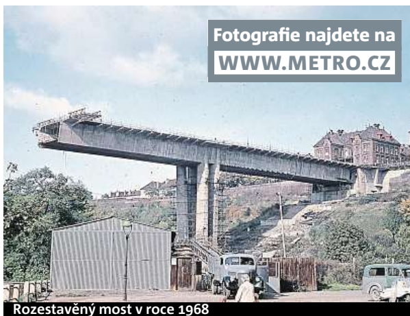
Rozestavěný most v roce 1968