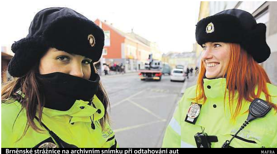
Brněnské strážnice na archivním snímku při odtahování aut

„My jsme si dali v roce 2014 za cíl navýšit počet stráž-