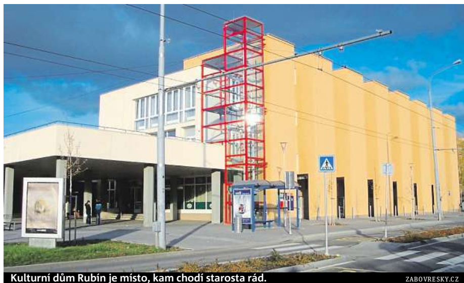
Kulturní dům Rubín je místo, kam chodí starosta rád.