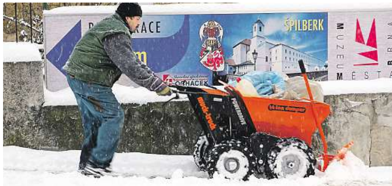
V lednu meteorologové zaznamenali 29 dní se sněhovou pokrývkou.

Letošní dlouhá a mrazivá zima se městu prodrazila.