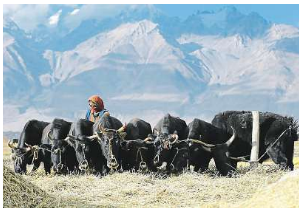
Návrat do Zanskaru

Nyní se rozhodli, ještě před úplným dokončením silnice, místo znovu navštívit, rodinu vyhledat a najít odpovědi na otázky, jak se osada a její obyvatelé za tu dobu změnili a jak je přijímána výstavba silnice a s ní i příchod civilizace. „Osobně se mi z letošních filmů nejvíce líbí Ultra Trail Gobi Race . Ukazuje sílu lidské vůle, krásu naší přírody a touhu po překonávání sebe sama.“ říká organizátor promítání Pavel Pichler z občanského sdružení Naboso. Poušť Gobi se rozkládá na se-