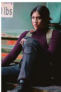
Mayu jsme naposledy viděli v povedeném Hawkeyeovi.