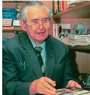
Spisovatel Jaroslav Foglar na snímku z roku 1994

První ze dvou chystaných velkoformátových knih se zaměří na komiksové příběhy, jejichž výběr vyjde spolu se scénáři, které ilustrátorům předepisoval a často i předkresloval Foglar. Fanoušci tedy budou moci porovnávat a také vidět, jak se komiks vyvíjel. Druhá kniha nahlédne do zákulisí stínadelské trilogie. Půjde o kombinaci zápisů, poznámek a rukopisů Foglara, když se svět Záhady hlavolamu, Stínadel se bouří a Tajemství Velkého Vonta snažil vymodelovat v hlavě.