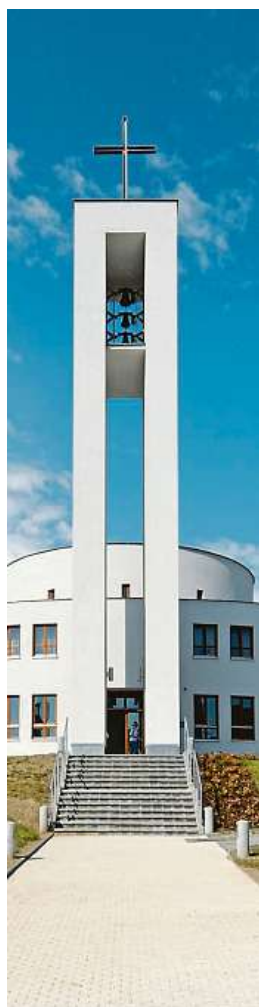
Centrum matky Terezy je u Modré školy. ONDŘEJ POLÁK