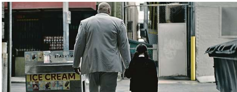
Nastavit druhou tvář není Kingpinův styl. A jak se ve scéně, jejíž konec vidíme na fotografii, ukazuje, jeho oblíbené bílé sako není nejpraktičtější oděv do rváčky.

zjišťujeme, že někteří členové rodiny musejí pro plešatého kápa newyorského podsvětí stále pracovat, a to i přesto, že má být již nějaký čas po smrti. Maya totiž Kingpina v Hawkeyeovi střelila do obličeje. Netušila nejspíš, že na tohohle hromotluka podobné kousky moc nefungují.