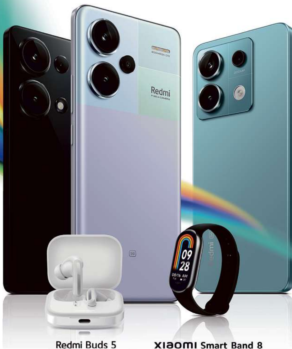
Redmi Buds 5