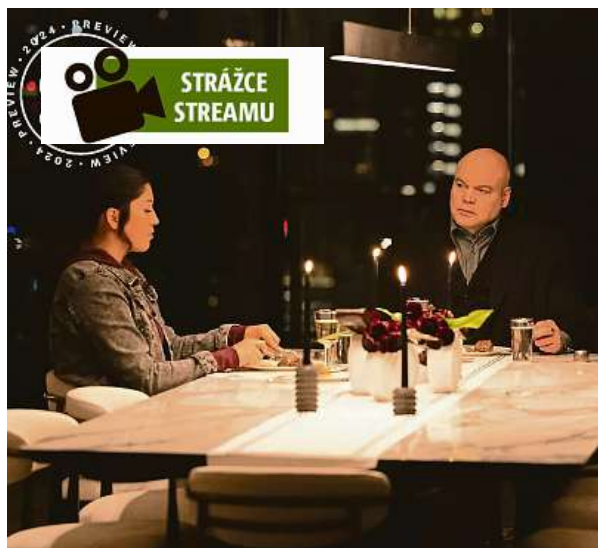
Maya Lopezová a Kingpin na nedělní večer. Maya je hlavní hrdinkou. Divák má ale problém najít si k postavě cestu či sympatie.

Jak jsem již nadnesl výše, dívka pocházející z indiánského národa Čokty se po letech života v opatrovnictví drsného Kingpina (Vincent D'Onofrio), který měl, jak se již v seriálu Hawkeye ukázalo, na svědomí smrt Mayina otce, vrací do svého rodiště v Oklahomě. Zde spolu s hrdinkou