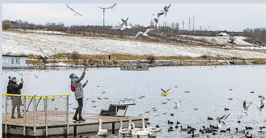
Jedno z nejvýznamnějších zimovišť vodních ptáků v Česku je jezero Most.