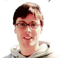
MARDOŠA ČLEN KAPELY TATA BOJS

Samozřejmě záleží na tom, kdo má jaké zařízení a v jakých službách je přihlášený. Těch kanálů jistě může být i mnohem víc. Navíc lidé, kteří používají jednu platformu, často „doporučují“ svým kamarádům, aby ji též používali. Obrany proti tomu není, obecně asi platí, aby se člověk tolik „nevykecával“, odpovídal stručně, věcně a aby mu to netrvalo věčně. I tak je ale tempo neúprosné, takže ani potom není záruka, že se všechno stihne. Když už toho je moc, pomáhám si tím, že jdu proti proudu. Z nádoby nezodpovězených mailů vytáhnu náhodně jeden, třeba z roku 2002, a na ten odpovím. Vyjadřuji tím naději, že se jednou dostanu ke všem restům a že žádný mail není zcela zapomenut. Byť pravděpodobnost, že odpověď ještě zastihne původního pisatele (natož jestli ho bude ještě zajímat), je minimální. O to mi ani tak nejde. Je to spíš jen takový můj malý, marný, ale důležitý protest proti spěchu. Nevdá, že bez úspěchu.