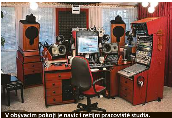
V obývacím pokoji je navíc i režijní pracoviště studia.