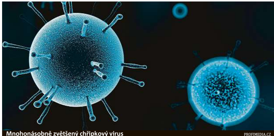
Mnohonásobně zvětšený chřipkový virus

Chřipka může zvýšit míru stresu v těle, což ovlivňuje hladinu cukru v krvi a vede k vážným zdravotním komplikacím. Uvádí se také,