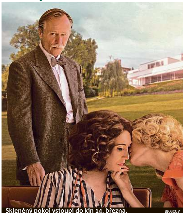
Sklenný pokoj vstoupí do kin 14. března.