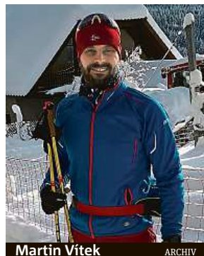
Martin Vítek ARCHIV

Díky tomu zná nejnovější trendy ve vybavení. „Nabídka