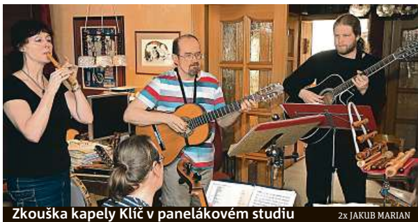
Zkouška kapely Klíč v panelákovém studiu